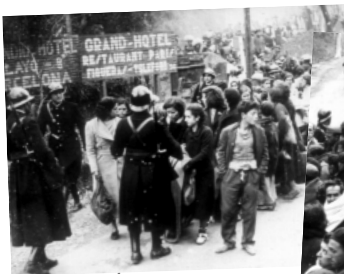
Réfugiés espagnols en 1939.