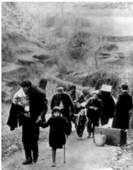
Réfugiés espagnols en 1939.

Les réfugiés apatrides ne peuvent plus légalement se déplacer, expulsés clandestinement par les autorités policières vers le pays voisin car ils ne peuvent être renvoyés nulle part ni recevoir un visa d'entrée. Ces expulsions connaissent comme on le sait une croissance exponentielle dans les années trente.