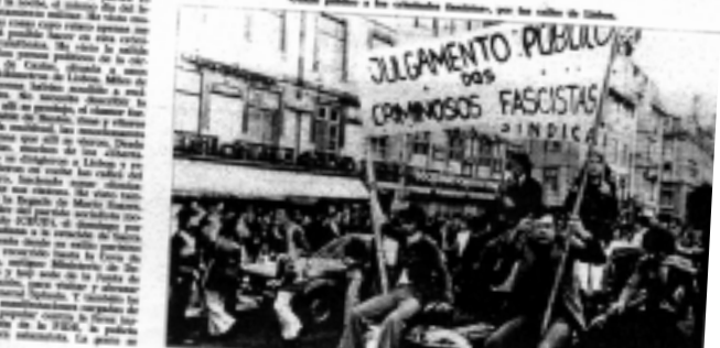
Una multitud en las celebraciones lisboenses por la caída de Salazar.

LISBOA es una fiesta. En el desarrollo, un hombre que ha sido un gran ejemplo de la democracia en el mundo. Su llegada a Portugal en 1961, tras haber estado en el exilio durante 15 años, marcó el inicio de una nueva era en la historia de Portugal. Lisboa, una ciudad vibrante, celebra la llegada de Soares.