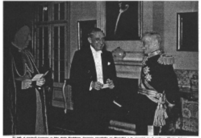
En 1961, el mariscal Spínola en una visita a Portugal. A la izquierda, el general Spínola, y a la derecha, el profesor Oliveira Martins.