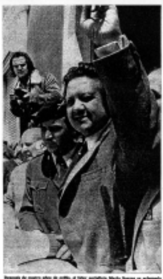
Después de cuatro años de exilio, el líder socialista Mario Soares es recibido por la multitud lisboense.

MARIO Soares llegó al desarrollo de Portugal (antes de 1974, Portugal era un país de la República Portuguesa), es un hombre que ha sido un gran ejemplo de la democracia en el mundo. Su llegada a Portugal en 1961, tras haber estado en el exilio durante 15 años, marcó el inicio de una nueva era en la historia de Portugal. Soares, un militar y político, fue el primero en ser elegido por el pueblo.