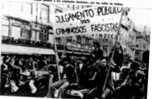
Un día festivo en las celebraciones de la liberación de Lisboa.

Después de haber estado en el exilio durante años, Soares regresó a Portugal en 1974. Su llegada fue recibida con entusiasmo por el pueblo portugués, que veía en él un símbolo de cambio y libertad.