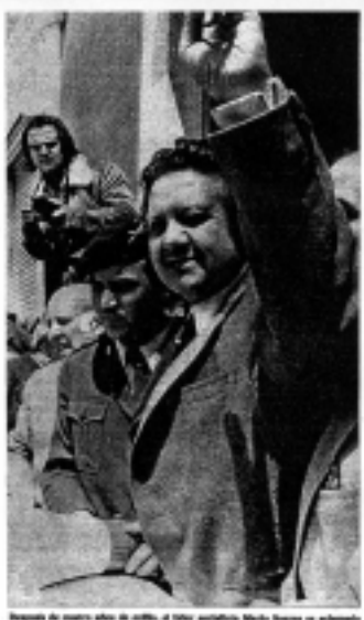
Soares en un momento de su vida. En primer plano Mario Soares en un momento de su vida.

MARIO Soares llegó al destierro a Portugal después de su larga estancia en el exilio. Su llegada a Lisboa en 1961 marcó el inicio de un período de transición que culminó con la revolución de los claveles en 1974. Soares fue un hombre que se comprometió con la democracia y la libertad. Su liderazgo fue fundamental para el establecimiento de un régimen democrático en Portugal. En la segunda guerra mundial, Soares fue un soldado valiente que luchó por la libertad. Su experiencia en la guerra le permitió comprender mejor las necesidades de la población portuguesa.