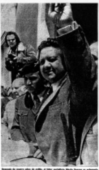
Después de cuatro años de exilio, el líder socialista Mario Soares se embarca por la ciudad de Lisboa.

MARIO Soares llegó al destierro a Portugal después de su larga estancia en el exilio. Su llegada fue recibida con entusiasmo por el pueblo portugués, que veía en él un símbolo de cambio y libertad. Soares fue un líder eficaz y un soldado valiente. Su experiencia en el campo de batalla le dio una perspectiva única de la guerra y del poder.