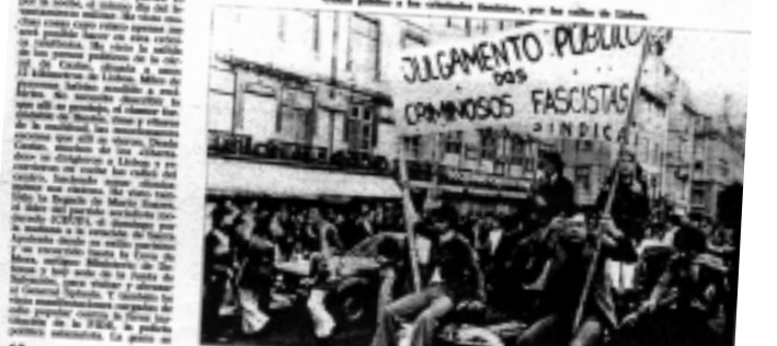
Una multitud en las calles de Lisboa, Portugal, durante la revolución de los claveles.

Las fiestas eran un reflejo del deseo de la población por un cambio en el régimen salazarista. La población portuguesa estaba celebrando el inicio de un período de transición que culminó con la revolución de los claveles en 1974.