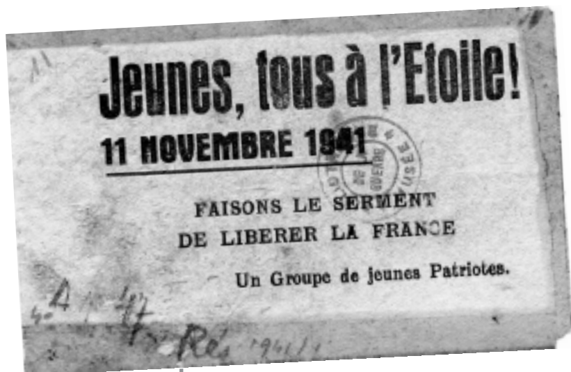
Papillon appelant à manifester le 11 novembre 1941.