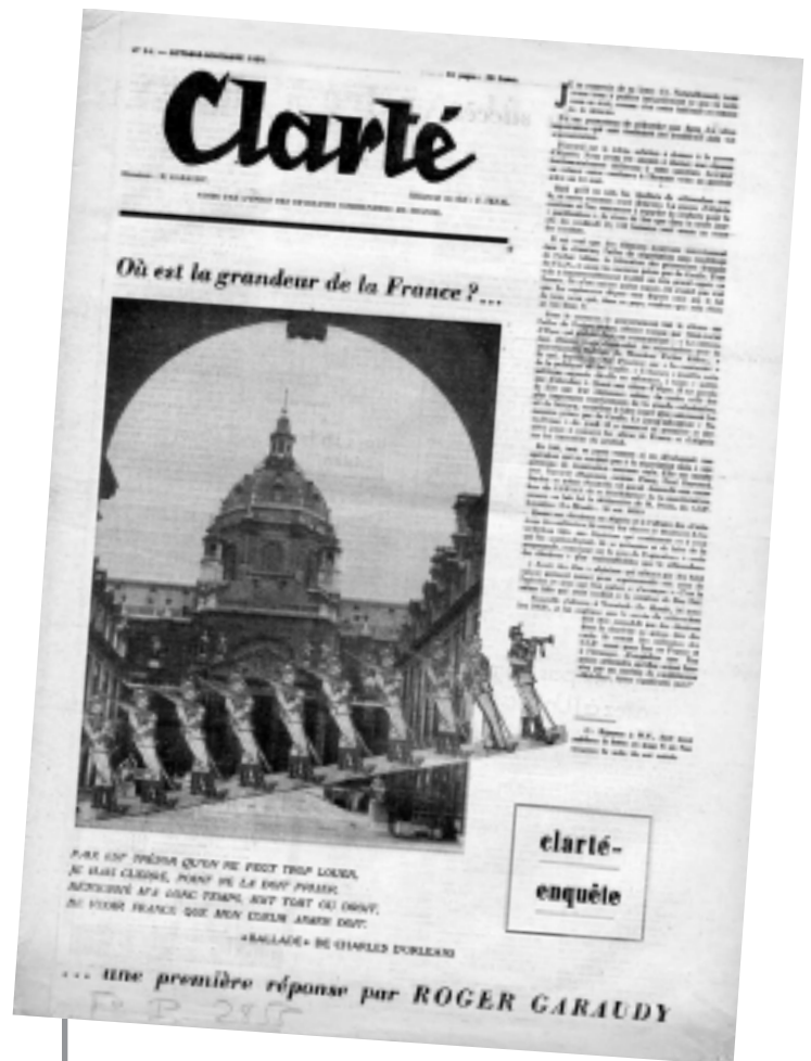
Clarté, journal des étudiants communistes, puis de l'UEC, créée en 1956.