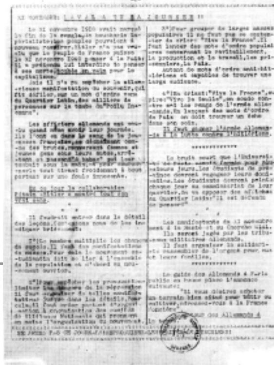
La Vérité, numéro 6 du 15 novembre 1940, relatant la manifestation du 11 novembre.