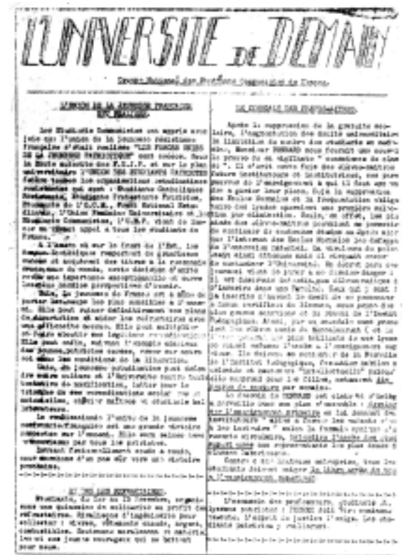
Journal des étudiants communistes en zone occupée (coll. BDIC).

Toutefois, cette démarche unitaire s'inscrit à contre-courant des divisions de la Guerre froide qui s'annoncent et sera sans lendemain.