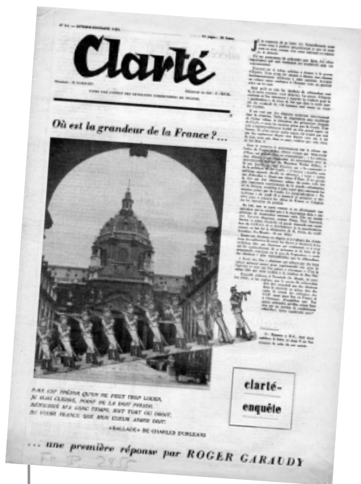
Clarté, journal des étudiants communistes, puis de l'UEC, créée en 1956.