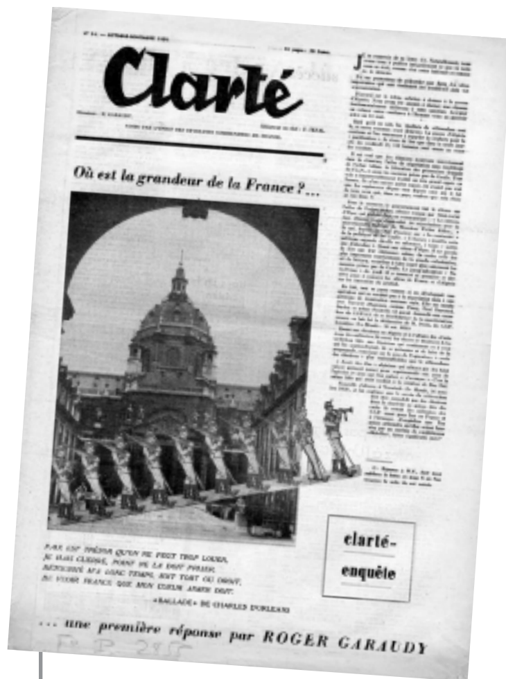
Clarté, journal des étudiants communistes, puis de l'UEC, créée en 1956.