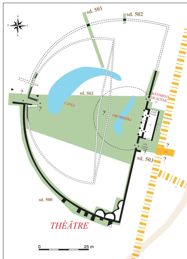
Eu, Bois l'Abbé, fig. 4 : plan interprété des deux états du théâtre de Briga (DAO : J. Parétias).

Après 25 ans d'interruption, la reprise des recherches sur l'édifice de spectacle a ciblé le bâtiment de scène (fig. 4 ; espace D) du second état daté de la fin du II e siècle ou du début du III e siècle. Déjà partiellement fouillée par Michel Mangard et Laurent Cholet dans la seconde moitié du XX e siècle, la fondation en rognons de silex du mur arrière du bâtiment de scène est désormais restituable sur 15,5 m de long pour 0,75 m de large. Parallèle à la façade du théâtre dont elle est distante de 4,2 m vers l'est, elle présente un état de délabrement avancé. En dépit des perturbations liées à des travaux de drainage effectués dans le secteur en 1974, son élévation, alternant une à deux assises de moellons de craie et de deux briques, était présente effondrée en place sur 1,4 m de large vers l'est. Jusqu'alors négligés, les ultimes vestiges d'un retour de fondation en rognons de silex qui assurait le contact avec le mur de façade et un effondrement vers le sud appartenant à son élévation invitent à reconsidérer la configuration de cette