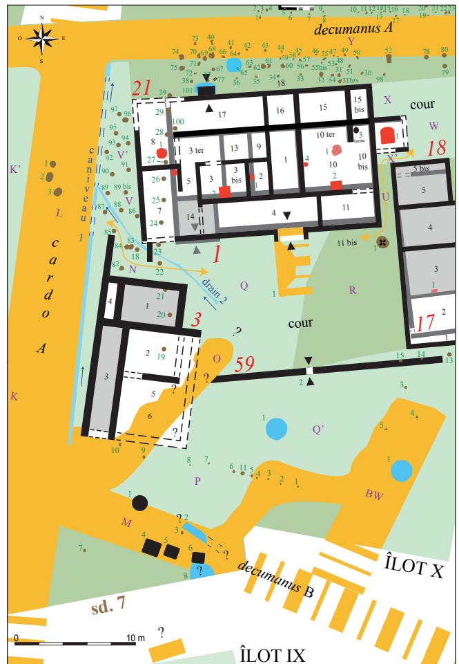
Eu, Bois l'Abbé, fig. 1 : plan interprété de la partie occidentale de l'îlot X située au sud des Bâtiments 1/21 (DAO : J. Parétias).