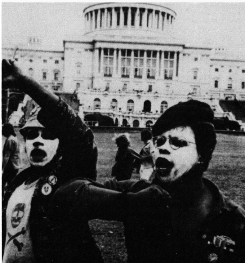
Manifestation devant le Congrès américain, Washington.