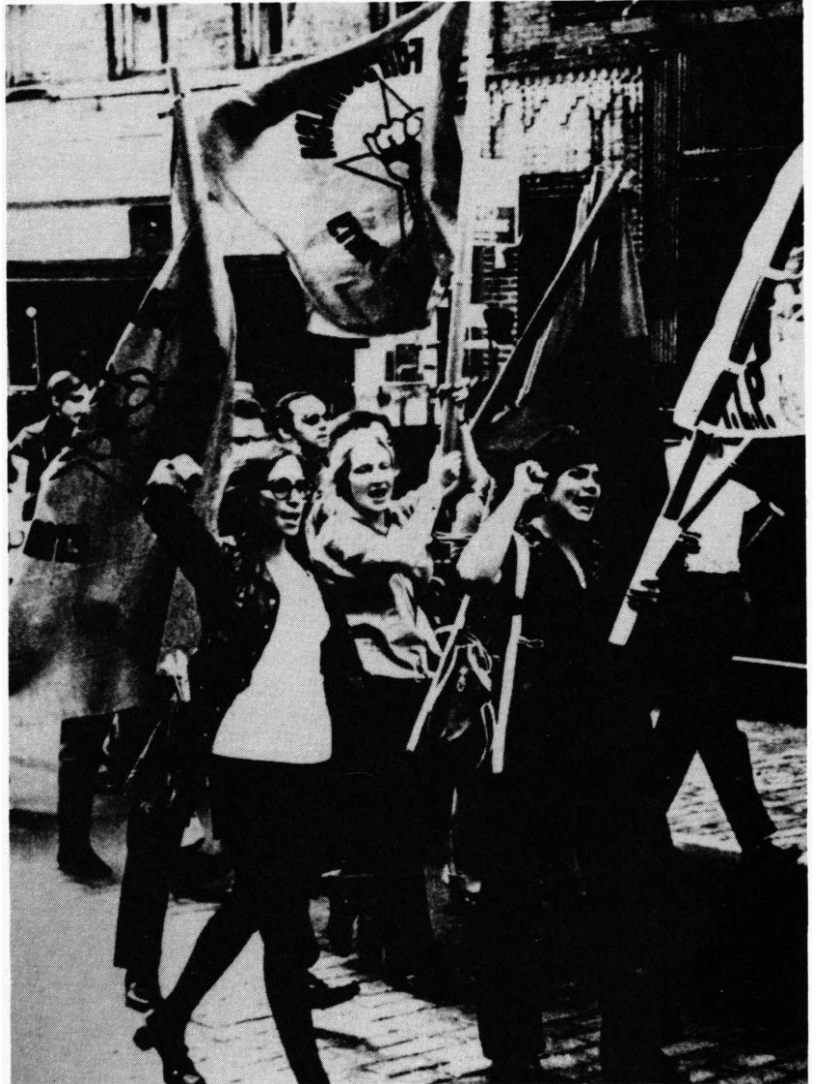
New York. 24 octobre 1970. Manifestation du Progressive Labor Party.

Mais la rupture avec les années soixante est moins profonde qu'il n'y paraît. D'une part, bon nombre de vétérans de la nouvelle gauche se sont réinvestis dans ce nouvel activisme qu'ils imprègnent de leur expérience. D'autre part il règne dans les rangs contestataires, aujourd'hui comme hier, une sensibilité libertaire qui entretient une grande méfiance à l'égard de l'organisation hiérarchisée et centralisée. Mouvements catégoriels et groupes locaux acceptent tout au plus de constituer des réseaux très lâches ( Citizen Action , formé en 1979, implanté dans 25 Etats et revendiquant deux millions d'adhérents) ou de former des coalitions aussi éphémères qu'hétérogènes pour organiser des manifestations de masse à Washington (du 19 au 24 avril 1985, une cinquantaine de milliers de personnes protestent à la fois contre l'intervention en Amérique centrale, la course aux armements, la discrimination raciale ou sexuelle, l'apartheid en Afrique du Sud ; le 25 avril 1987, environ 35 000 personnes défilent contre la politique centre-américaine de Reagan 17 ). Comme dans les années soixante, les petites formations politiques visant à regrouper les protestataires à l'échelle nationale ( Citizens Party , Democratic Socialists of America ) n'ont pas réussi à constituer des pôles d'attraction durables, capables de menacer l'hégémonie du Parti démocrate ou de «réaligner» à gauche ce dernier.