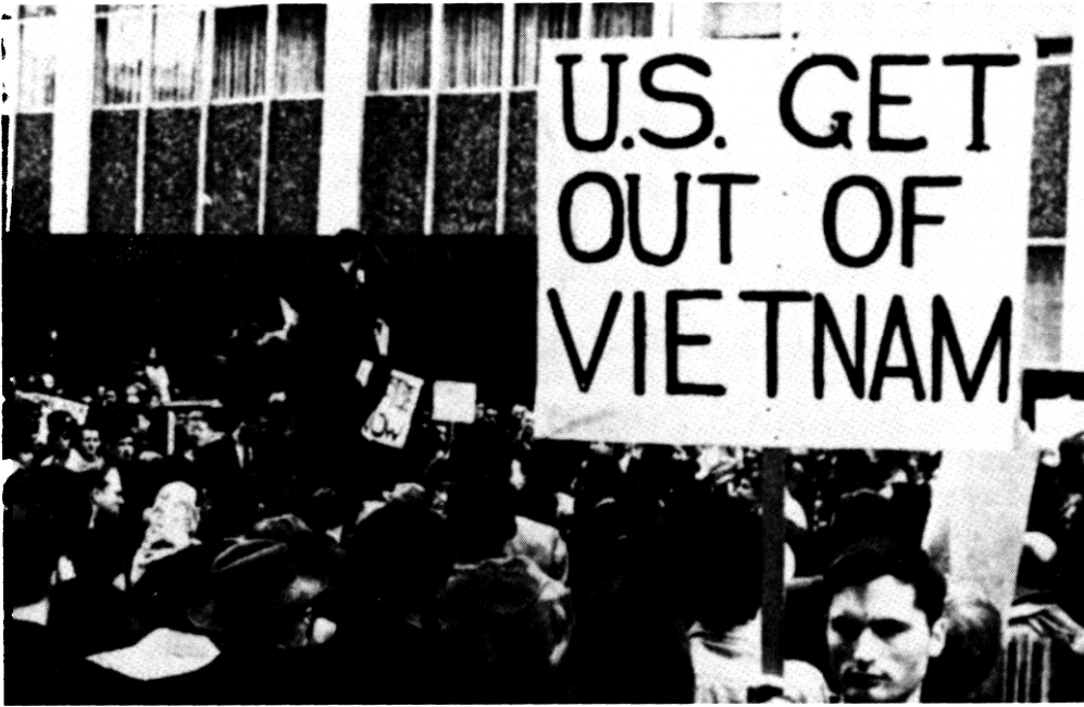
Manifestation à l'Université de Berkeley.

démocratie représentative. La nouvelle gauche a encore moins réalisé son rêve ultime de créer une organisation révolutionnaire structurée et efficace. Ce double échec s'explique en partie par des éléments extérieurs au Mouvement - répression 11 , système politique bi-partisan qui rejette à la marge les protestataires ou les neutralise en les absorbant 12 . Mais le déclin de la nouvelle gauche est surtout imputable aux attitudes cultivées, dès le départ, par les activistes étudiants et poussées au paroxysme en 1968-1969 : activisme anti-intellectuel , qui favorisa un confusionnisme idéologique propice à la diffusion aussi bien du prêt-à-penser marxiste que des délires «mystiques» de la contre-culture (non réductible à cet aspect) ; moralisme existentiel qui, sous prétexte d'harmoniser ses convictions et sa manière de vivre, aboutit le plus souvent à faire de l'action une fin en soi, une épreuve où se joue le salut individuel plutôt qu'un moyen au service d'un projet politique ; sentiment de culpabilité incitant les étudiants, issus de milieux relativement favorisés, à adopter une fausse identité de classe , à s'assimiler aux pauvres, aux prolétaires ou aux «damnés de la terre» ; sensibilité libertaire , qui entrava l'organisation de l'action, attisa la méfiance des partis et du jeu politique, suscita un anti-électorisme et un anti-étatisme croissants, paralysant et isolant la