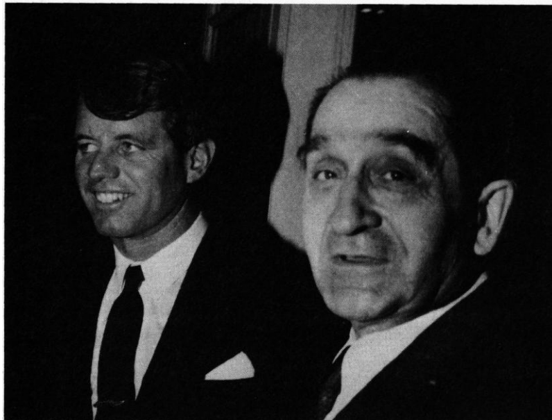
Robert Kennedy et Pierre Mendès-France.