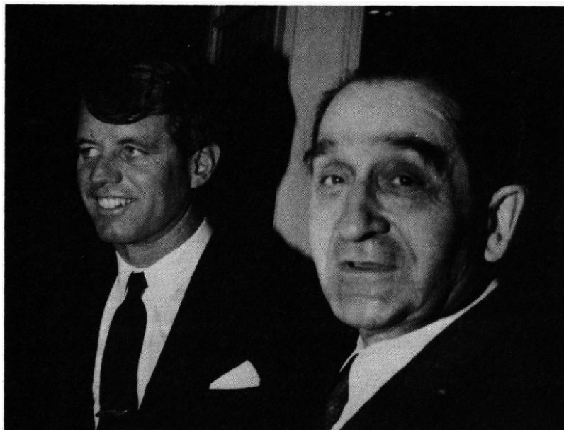
Robert Kennedy et Pierre Mendès-France.