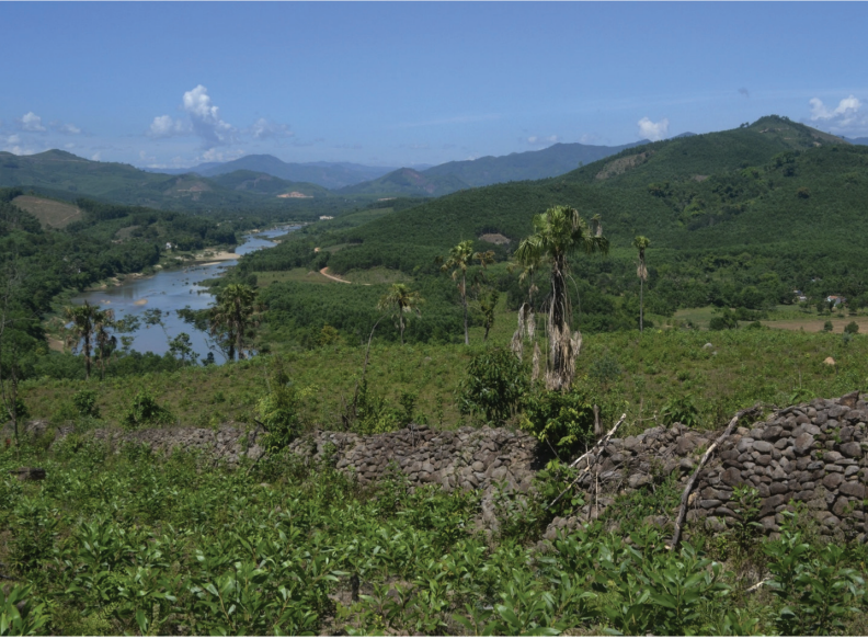
FIG. 1. – La muraille de Quảng Ngãi, construite en 1819. Village de Tân Long Hạ, commune de Ba Động, district de Ba Tư, province de Quảng Ngãi, 2015.

fois le dispositif mis en place à l'origine 6 . Nguyễn Tấn décrit ses campagnes militaires ainsi que ses pourparlers avec les chefs Hrê, et il note même les noms de ces derniers : Đĩnh-y pour la Première Marche, Đĩnh-gi et Đĩnh-lai pour la Deuxième Marche, etc 7 .