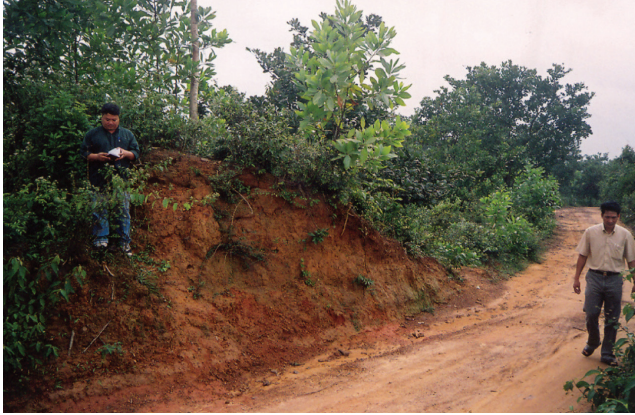
FIG. 2. – L'architecture de la muraille : terre battue. Commune de Long Son, district de Minh Long, province de Quảng Ngãi, 2008.