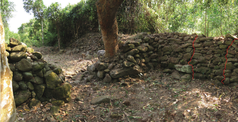
FIG. 9. – Au fort de Rùm Đôn, la muraille et la route N-S qui passe par une porte dans le mur transversal. Sur l'extrême droite de l'image : une porte, aujourd'hui comblée, permettait le passage E-O à travers la muraille, 2010.