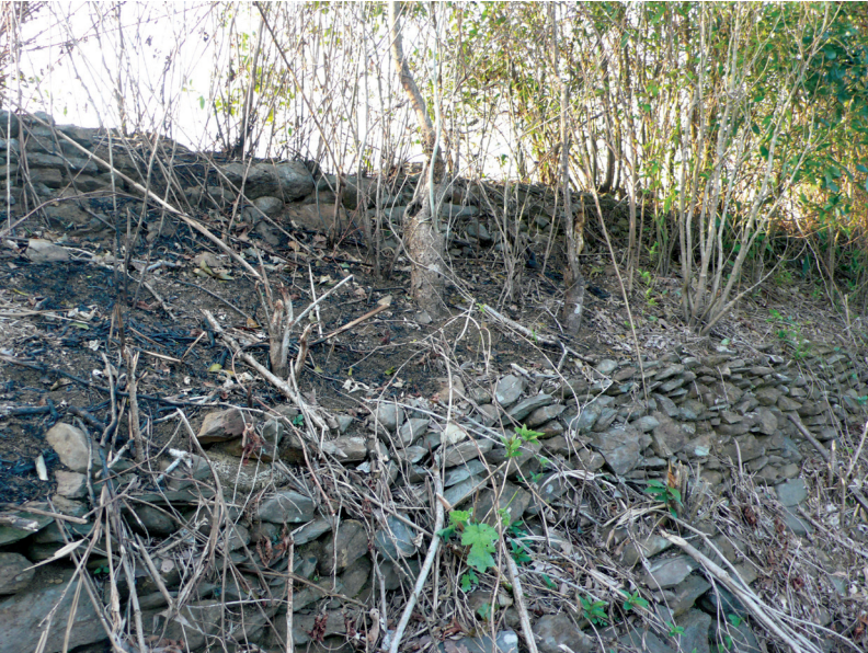
FIG. 11. – La muraille de Bình Định, construite en 1876. Village de La Vương, commune de Hoài Sơn, district de Hoài Nhơn, province de Bình Định, 2015.