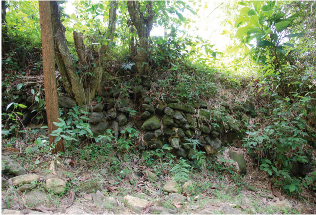
FIG. 3. – L'architecture de la muraille : pierre sèche. Commune de Trà Phú, district de Trà Bồng, province de Quảng Ngãi, 2008.