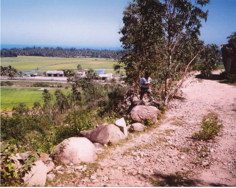
FIG. 5. – Vestiges d'une route ancienne. Commune de Phố Châu, district de Đức Phổ, province de Quảng Ngãi, 2006.