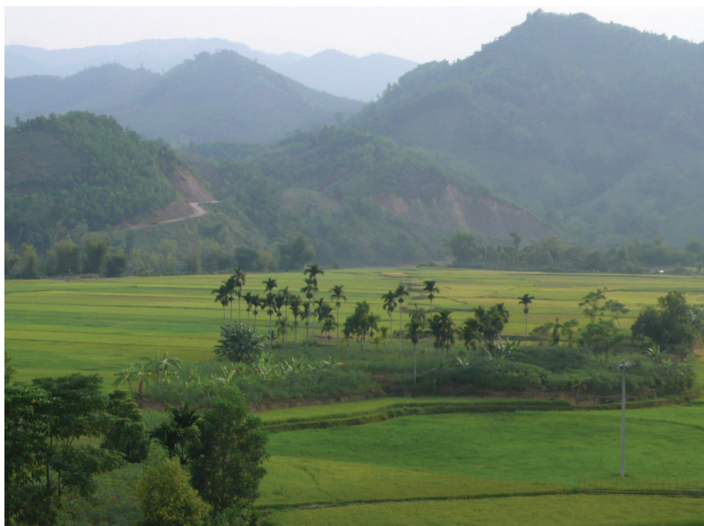
FIG. 7. – Les rizières de la vallée de la rivière Đak Rin. District de Son Hà, province de Quảng Ngãi, 2011.

Ce qu'a montré la prospection, c'est que les intérêts à ériger une muraille étaient des intérêts partagés. La construction d'une limite en dur, inscrite dans la topographie du territoire, visait autant à interdire aux guerriers Hrê l'accès à la plaine qu'elle servait à barrer la haute région aux migrants Việt ; et, loin de chercher à sceller la frontière de manière hermétique, elle avait à l'inverse pour objectif de sécuriser un commerce transfrontalier qui était d'une importance vitale pour les deux peuples.