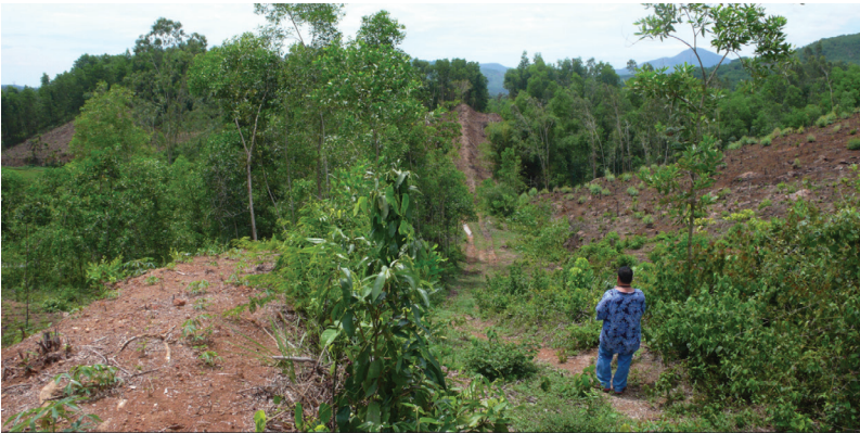
FIG. 6. – Une route longe la muraille. Commune de Sơn Hạ, district de Sơn Hà, province de Quảng Ngãi, 2010.