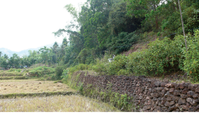
FIG. 10. – Bordure d'une rizière Hrê, revêtue en pierre. Commune de Son Kỳ, district de Son Hà, province de Quảng Ngãi, 2011.