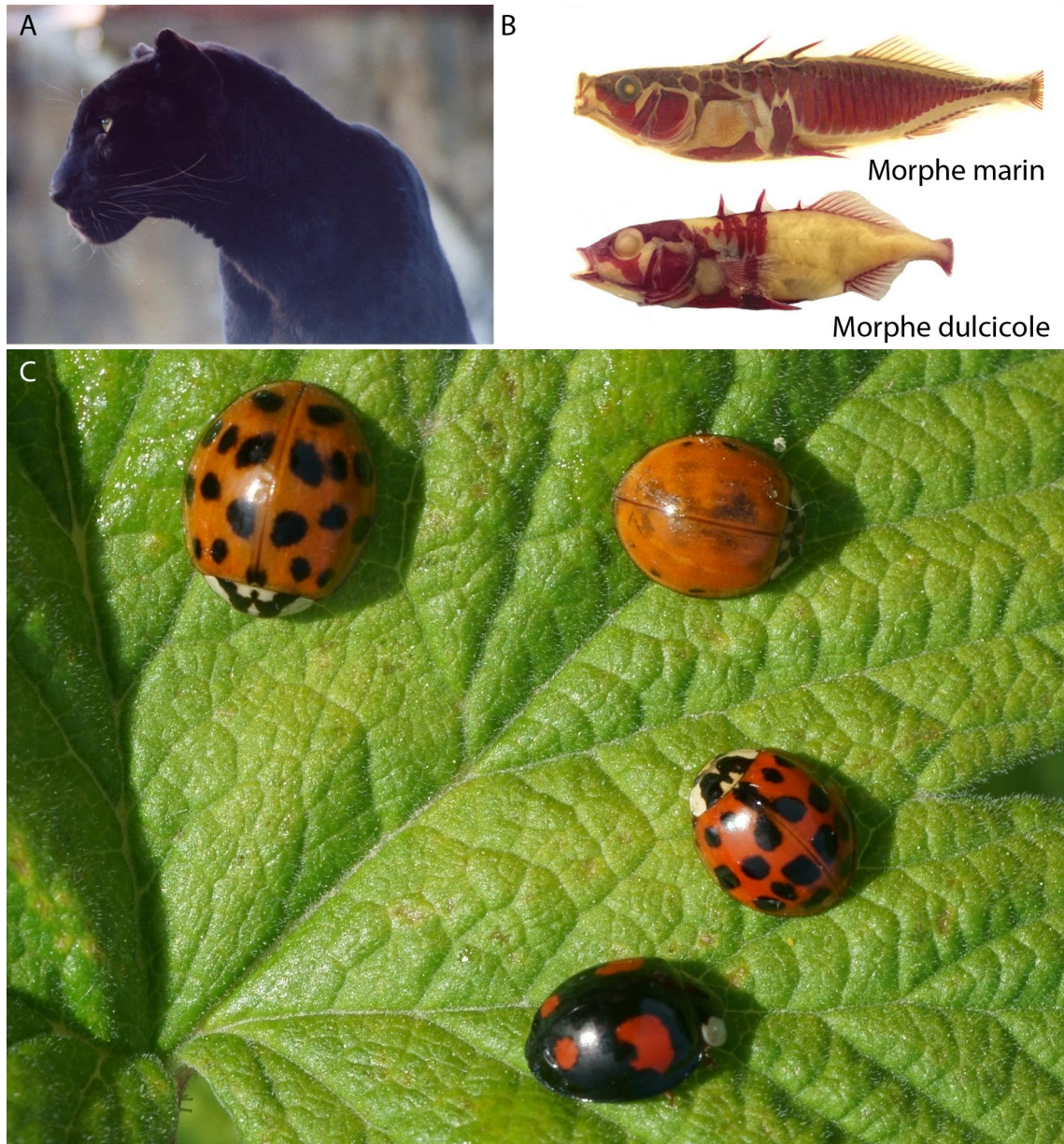
Figure 2 : Exemples illustrant des phénotypes dont les bases génétiques ont été identifiées par différentes approches.

chromosome X de Drosophila simulans , montre que cette région ségrège normalement au cours des mitoses dans un embryon de Drosophila melanogaster (C) tandis qu'elle est précisément localisée dans les ponts des mitoses anormales des embryons femelles hybrides D. melanogaster/D. simulans (D). Barre d'échelle : 5 \mu m.