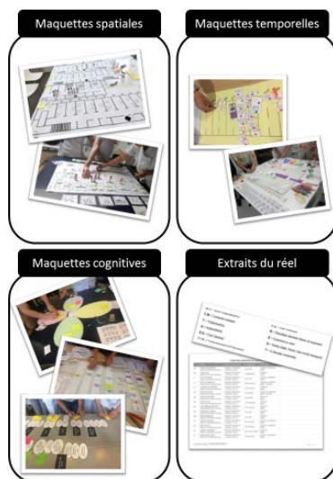
Figure 2. Objets intermédiaires construits pour animer les 8 groupes-terrains consacrés à la projection des solutions (phase 3)

Les maquettes spatiales étaient des représentations du service à échelle réduite, sur lesquelles les participants déplaçaient des jetons et/ou des figurines. Les maquettes temporelles étaient des frises chronologiques sur lesquelles les participants déplaçaient des jetons, des étiquettes et/ou des curseurs. Les maquettes cognitives étaient des représentations d'un ou plusieurs raisonnement(s) associé(s) aux solutions projetées, sur lesquelles les participants écrivaient leurs idées. Les extraits du réel étaient des outils ou des résultats de l'activité de travail, préalablement « extraits » de la situation de travail (ex. anciennes listes de patients, enregistrements de transmissions orales). Ils étaient manipulés et commentés par les participants. Généralement, l'animation des groupes-terrains était structurée en deux temps. D'abord, les participants étaient invités à « simuler » les changements induits par les solutions, en manipulant les objets intermédiaires selon des consignes précises. Ensuite, nous commentions leurs manipulations et les invitions à les expliquer rétrospectivement. Les 8 groupes-terrains ont été photographiés et enregistrés au dictaphone avec l'accord des participants. Les enregistrements ont été retranscrits intégralement.