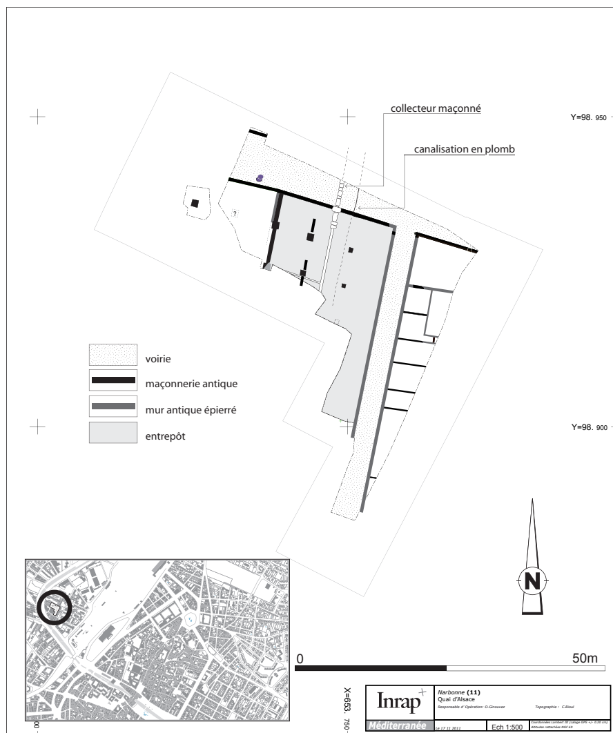
Fig. 1 – Plan général de la fouille du 14 quai d'Alsace (C. Bioul et O. Ginouvez, Inrap 2012).

d'eau. On pense bien sûr à l'installation d'un port fluvial, dont la localisation précise n'est pas encore arrêtée, et à son environnement urbain 3 .