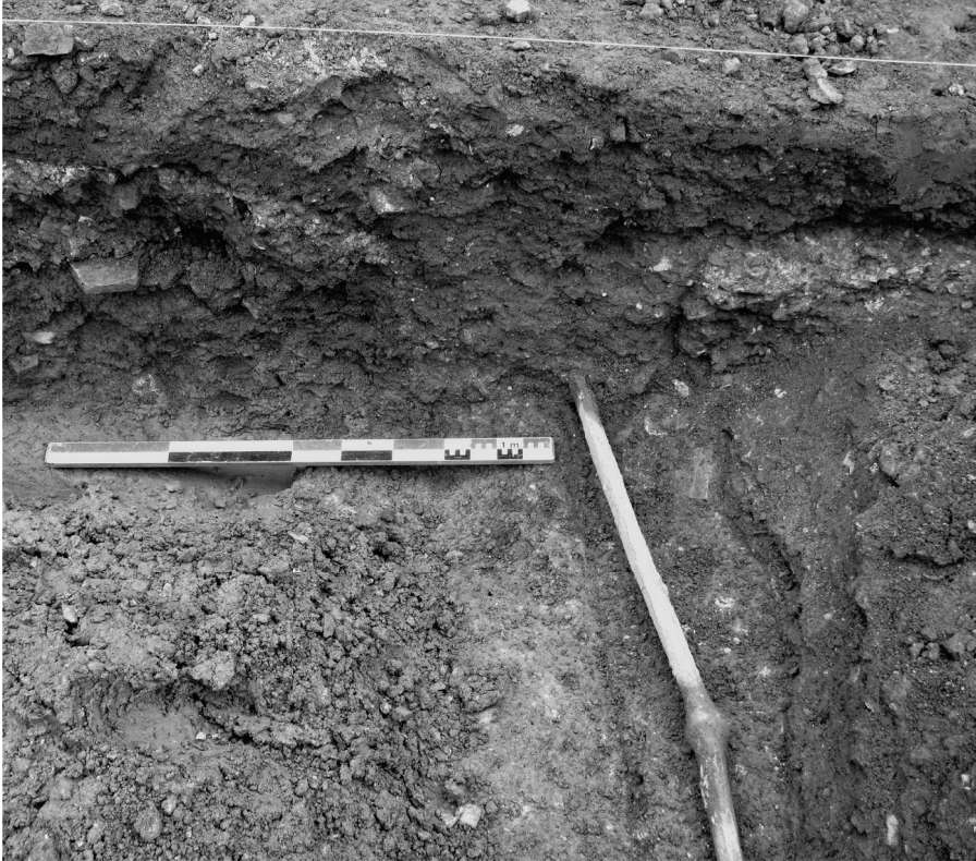
Fig. 2 – Le tuyau en plomb lors de sa découverte (cliché O. Ginouvez, Inrap 2012).

La conduite mise au jour au 14 quai d'Alsace est composée de deux tuyaux assemblés par un emboîtement dont la protection et la solidité ont été assurées au moyen d'un nœud de soudure à l'étain : c'est la jonction dite « en olive », selon Cochet et Hansen 6 . Les deux éléments ne sont pas complets et mesurent respectivement 2,06 et 1,74 m de long 7 . Chacun est de section piriforme et présente une soudure longitudinale matérialisée par un cordon grossièrement rectangulaire 8 (fig. 3).