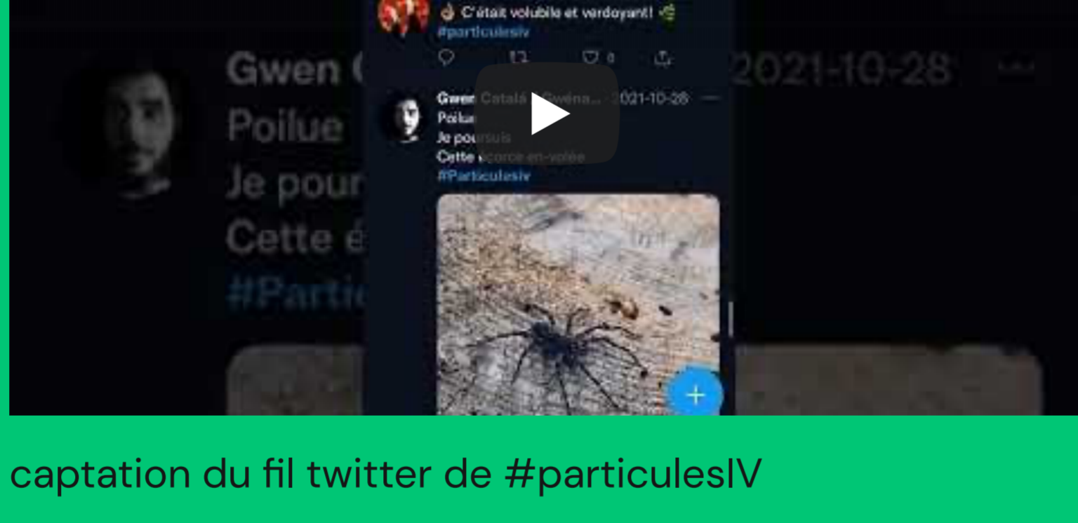
capture du fil twitter de #particulesIV

Lors de chaque édition, des artistes visuels et des écrivain.e.s professionnel.le.s sont invité.e.s à publier des tweets sur une thématique donnée, en mettant leurs gazouillis en réseau par l'utilisation d'un même mot-clé. Puisque les publications sont instantanément disponibles, des conversations se créent. Le mot-clé fédère ainsi les auteur.rice.s et constitue une anthologie mouvante de tweets poétiques, textuels, iconiques ou iconographiques. L'ouverture de la performance au grand public permet également de recueillir les gazouillis d'internautes qui n'ont pas nécessairement une pratique artistique professionnelle. L'expérience artistique est alors partagée : les publications amateurs et celles d'artistes chevronné.e.s apparaissent sans hiérarchie, s'imbriquant et se mêlant en conversations inattendues.