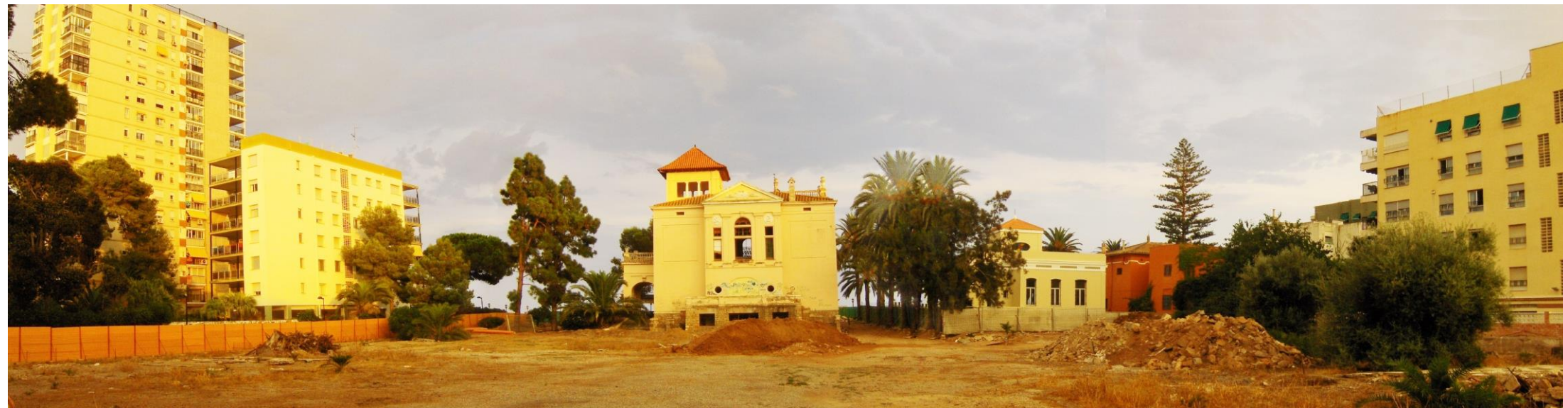
Figures 31. Manifestation « Belle Époque 2015 », déguisement des habitants, restauration d'une maison dans un environnement sous pression immobilière, 2014, Patrice Ballester.