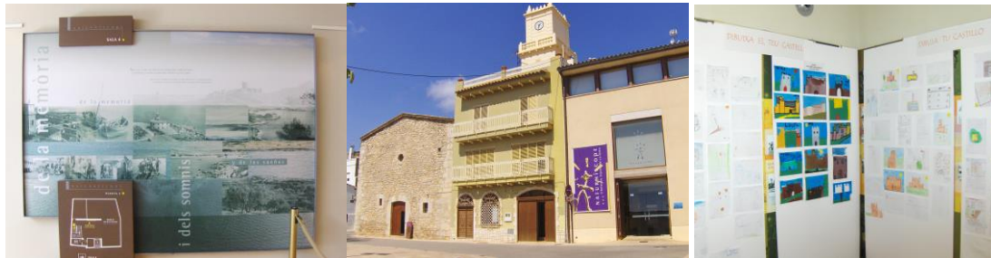
Figure 30. Naturhiscope, 2014, salle de projection interactive, document mémoriel et travaux d'enfants, 2014, PB.

Le fait de faire venir les touristes en journée dans le centre-ville historique est un pari, alors qu'en soirée, la ville s'anime avec les bars et les restaurants ou foire antique permanente.