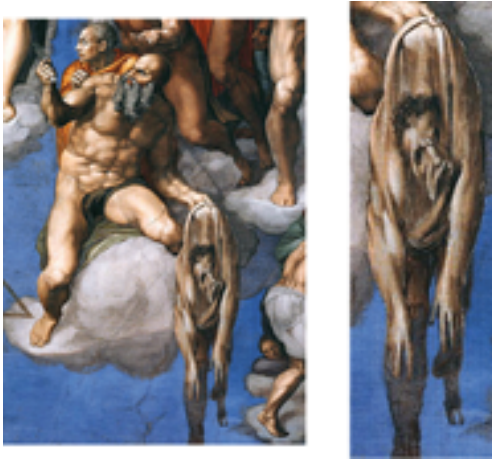
Michel-Ange, Le Jugement dernier (1534-1541), fresque, Rome, Chapelle Sixtine, détails