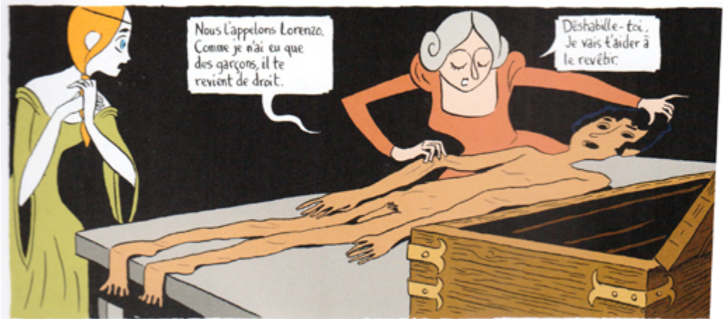
Peau d'Homme, de Hubert et Zanzim © Editions Glénat, 2020, p. 14

La « peau d'homme » dont se couvre Bianca est donc loin d'être un vêtement textile impersonnel. Mieux : elle présente aussi un visage. Ce qui suscite d'autres questions : comment la marraine de la jeune femme a-t-elle obtenu cette peau ? Et qu'est-il advenu du corps de Lorenzo ? Dans une vignette, il apparaît comme le souvenir d'un défunt, exhumé d'un coffre-cercueil par la marraine ; mais seule demeure l'enveloppe évidée, dépecée post-mortem par un taxidermiste. Nulle trace de chair purpurine ni de cadavre. Le corps du jeune homme est totalement absent de la narration ; il a disparu et n'a peut-être jamais été.