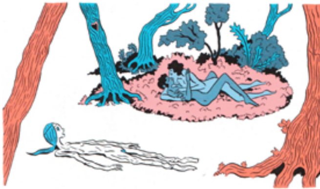
Peau d'Homme , de Hubert et Zanzim © Editions Glénat, 2020, p. 49

Mais Bianca n'épouse-t-elle pas aussi le « Moi-peau » [7] de l'autre, au point de s'aliéner en lui ? Comme le suggère un des épisodes les plus intéressants de la bande dessinée, cette peau se complexifie au fil de l'intrigue et devient un écran de projection psychique, où s'exprime une intense vie intérieure. Bianca fait ainsi un terrible rêve dans lequel elle se voit devenir une pellicule informe et flétrie, double fantomal d'elle-même. Giovanni étant tombé amoureux de Lorenzo, son corps à elle n'est plus qu'une pelure inutile :