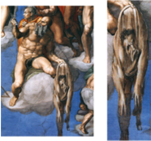
Michel-Ange, Le Jugement dernier (1534-1541), fresque, Rome, Chapelle Sixtine, détails