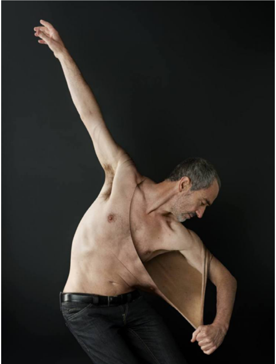
Nicole Tran Ba Vang, Corps À Corps avec Angelin Preljocaj , photographies, 2011 © Nicole Tran Ba Vang.