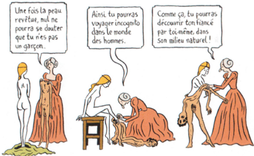
Peau d'Homme , de Hubert et Zanzim © Editions Glénat, 2020, p. 15.

Devant ce joyeux carnaval censé se dérouler au XV e siècle, il ne faut pas s'offusquer des nombreux anachronismes ni chercher une exacte reconstitution historique. C'est surtout de thèmes actuels que traite cette œuvre multiprimée : place des femmes dans la société, inégalité des sexes, mariages arrangés (qui concernent encore des millions de jeunes filles dans le monde), quête identitaire de genre, polyamours, homophobie et homoparentalité, montée des intégrismes religieux... L'idée de ce roman graphique est venue au scénariste Hubert, militant de la cause gay, après les manifestations contre la loi dite du « Mariage pour tous » en 2013. Écœuré et blessé par les réactions haineuses, il livre une ode à la tolérance et à la liberté ; grâce à son compagnon de plume, le dessinateur Zanzim, il dénonce avec humour la morale puritaine et le fanatisme, en invitant le lecteur à s'émanciper de toutes les formes de coercition ou d'oppression.