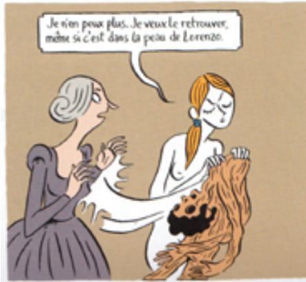
Peau d'Homme , de Hubert et Zanzim © Editions Glénat, 2020, p.85

13. « Je vis ici claquémuré comme la moelle/ dans son écorce, pauvre et seul,/ tel un esprit emprisonné dans une ampoule [...] / J'ai un frelon dans la fiole ; j'ai des os assortis de ligaments dans un sac de cuir/ et j'ai trois pilules de poix dans une gousse. » (Michel-Ange, « Tercets sur son propre sort », LXIX, in Poèmes , trad. P. Leyris, Paris, Gallimard, 1983, p. 111). « Écorce », « ampoule », « fiole », « sac », « gousse » : autant de contenants qui expriment la précarité du corps et l'enfermement de l'esprit.