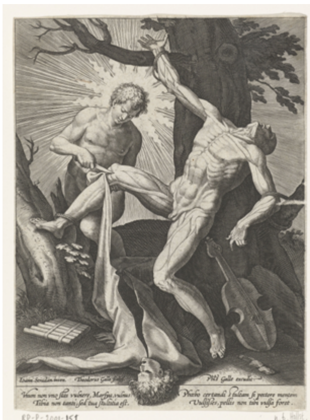
Theodoor Galle, d'après Jan van der Straet, dit STRADANUS, Apollon écorchant Marsyas, vers 1580-1600