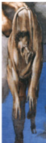
Michel-Ange, Le Jugement dernier (1534-1541), fresque, Rome, Chapelle Sixtine, détails