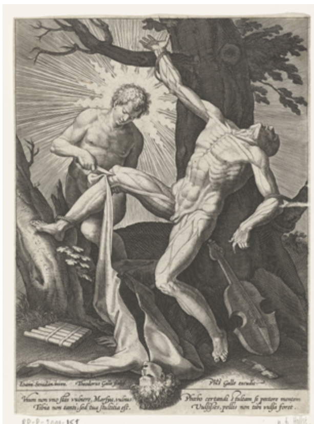
Theodoor Galle, d'après Jan van der Straet, dit STRADANUS, Apollon écorchant Marsyas, vers 1580-1600

Car avant d'être lascive, la chair de Lorenzo a pu être mortifiée. Le mystérieux jeune homme a peut-être été supplicié, comme le satyre Marsyas le fut par le dieu jaloux Apollon. Dans ses Métamorphoses (VI, 382-400), Ovide décrit comment le malheureux musicien, arraché à lui-même, les nerfs à vif, n'est plus qu'une plaie, puis finit par mourir dans d'inimaginables souffrances, le sang ruisselant de sa carcasse pantelante et désarticulée :