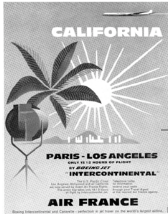
Paris-Los Angeles en 12 heures. Publicité Air France, avril 1960. (Coll. part.)

Ils voyagent avec le Fielding's Travel Guide to Europe , qui depuis sa première édition de 1948 est révisé chaque année. Aux dires de ses deux rédacteurs, les époux Fielding, c'est un ouvrage destiné au « typical American who came from Middletown, USA ». Le guide essaie de l'avertir des nombreux pièges à éviter (pourboires, taxes, langue, abus, etc.), mais il véhicule aussi énormément de clichés et de topos. En 1957, un autre guide apparaît, édité par Arthur Frommer, Europe On a $5 a Day (à compter de 1960, 150 000 Américains achètent sa version papier à 1,95 dollars), qui se veut critique vis-à-vis du conformisme de la classe moyenne et offre une échappatoire à la culture de masse — ce qui prouve que l'idéal des partisans américains de la consommation de masse de guerre froide n'est pas si évident à réaliser.