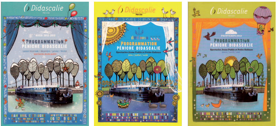
1b. Le canal du Midi au fil des saisons. [Péniche Didascalie, au fil des saisons. Ramonville, 2012/2103. Été/hiver/printemps. Droit de reproduction autorisé pour l'ouvrage.]