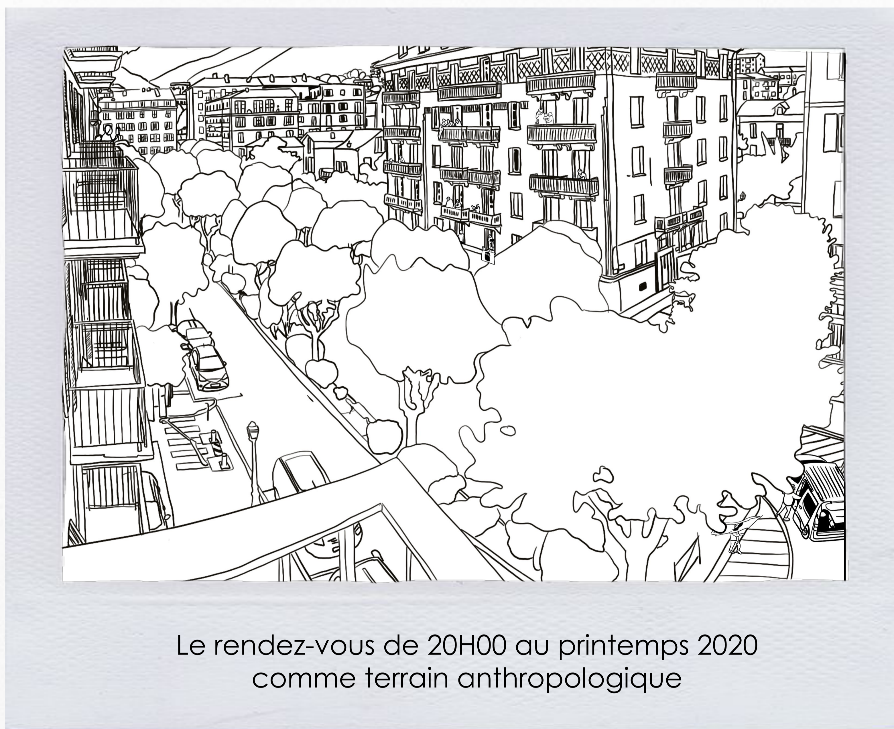
Le rendez-vous de 20H00 au printemps 2020 comme terrain anthropologique