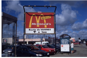
Communication commerciale le long d'une des pénétrantes de Nantes, 1999

– d'autre part, les enseignes ou l'intitulé du commerce ne font plus corps, ou de moins en moins, avec le local commercial, comme autrefois. Ils se présentent plutôt comme des prothèses visuelles, aisément fixables sur toute façade et tout aussi aisément supprimables.