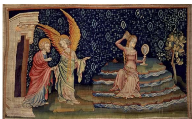
La Grande Prostituée, panneau de la Tapiserie de l'Apocalypse , Angers, 1375-1382

Mais, pendant très longtemps, ils sont restés l'apanage des riches demeures. En voici quelques exemples parmi les premiers représentés en image :