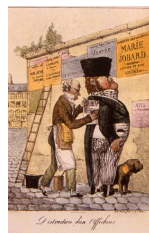
« Distraction d'un afficheur » : Dessin satirique sur les colleurs d'affiches, 1820

La seconde moitié du XIX e siècle vit apparaître, puis se développer la publicité . Celle-ci était d'abord essentiellement écrite , puisque les spectacles, puis les produits manufacturés, industriels, qu'elle vantait, s'adressaient en priorité à une clientèle dont le niveau d'éducation était synonyme de culture et inséparablement de revenus, donc de potentiel d'achat. La publicité concerna d'emblée les classes moyennes.