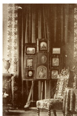
Baron Jean-Baptiste Louis Gros, Vue de son salon, 1844, daguerréotype

Quoi qu'il en soit, la photographie est entrée dans l'univers quotidien sous la forme d'albums de famille, de boîtes à chaussures remplies de clichés en vrac et de portraits encadrés posés sur la table de nuit de la chambre ou, moins souvent, accrochés au mur :