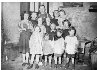
Intérieur d'une famille pauvre (murs nus), France, 1929

Le papier peint a été la première forme d'utilisation massive de l'image à des fins de décoration domestique. Son ancêtre, nous l'avons vu, fut la tenture, puis le tissu uni ou imprimé (toujours utilisé). Quant au papier peint proprement dit, il existe depuis la fin du XVIII e siècle, mais il était alors très peu utilisé. Sa production en série date des années 1840-1860, grâce à l'utilisation de rouleaux de papier imprimés en continu par des cylindres gravés. Dès lors, son essor commercial fut très rapide. Mais encore une fois d'abord dans les appartements bourgeois citadins, ceux-là mêmes que multipliaient à Paris les grands travaux du baron Haussmann. Par contraste, il faudrait pouvoir préciser à partir de quand les maisons de village ou les habitations paysannes ont adopté ce nouveau style d'habillage des murs : certainement beaucoup plus tard, et souvent pas avant les années 1930-1940. Quant aux logements des fractions les plus pauvres de la population, ils restèrent longtemps étrangers à cette évolution, encore qu'il soit difficile, faute de traces systématiques, de donner sur cette question une perspective historiquement correcte.