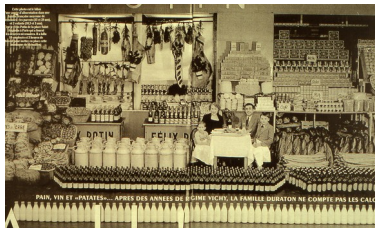
La consommation annuelle d'une famille (part importante des produits en vrac), 1951