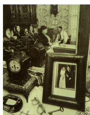
Robert Doisneau, La cheminée de Madame Lucienne (grand miroir et photo de mariage), 1953