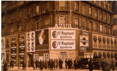
Publicités collées sur des palissades, Paris, boulevard Sébastopol, 1930

Sitôt qu'il devint possible et rentable, l'essor des affiches papier fut spectaculaire :