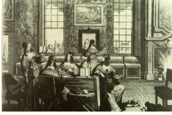
Abraham Bosse, Les Vierges folles (avec un grand miroir), 1635