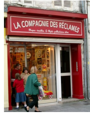
Boutique spécialisée, La Rochelle, 2004

Très vite, la publicité envahit les rues des grandes villes, celles-là mêmes où s'ouvraient les grands magasins ou les boutiques de confection industrielle.