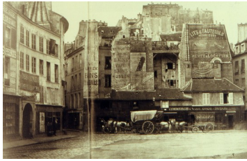
Charles Marville, Place Saint-André des Arts à Paris, 1870

Très vite, la publicité envahit les rues des grandes villes, celles-là mêmes où s'ouvraient les grands magasins ou les boutiques de confection industrielle.