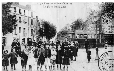
Carte postale de la place Émile Zola à Nantes, 1907 (noter la publicité sur le tramway)

Non seulement donc, la photographie donna aux individus un accès, souvent le premier, à leur propre image, mais encore elle permit aux autres de prendre connaissance à distance de leur aspect physique. Jusque là, il fallait avoir rencontré quelqu'un pour savoir à quoi il ressemblait. Désormais, la vision précédait la rencontre, l'expérience vécue, et cette anticipation par l'image allait devenir la règle dans la plupart des compartiments de la vie sociale.