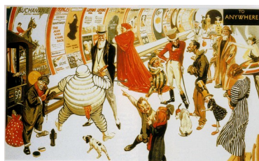
International Advertising Exhibition, 1920

Cette annonce d'une exposition internationale est révélatrice de l'importance prise par la publicité dès le début du XX e siècle :