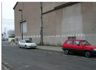
Mur portant encore l'interdiction, Nantes, 2004

Cette nouvelle forme d'affichage nécessita en outre la délimitation d'emplacements réservés. Depuis la fin du XIX e siècle, l'évolution a été dans le sens d'une mise en ordre croissante des espaces selon leur destination : respect des façades d'immeubles par le biais de lois interdisant l'affichage sauvage :