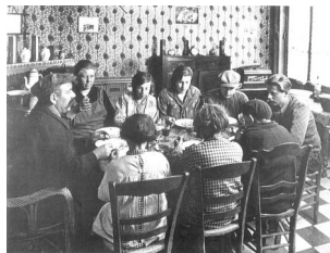
François Kollar, Repas dans une famille de mineur (carrelage et papier peint), Lens, 1931

En France, le grand essor populaire du papier peint date des années de reconstruction qui suivirent la fin de la Seconde Guerre mondiale. Les fabricants se sont ingénié à produire des papiers résistants et imperméables susceptibles de tapisser aussi bien la salle de bain que les