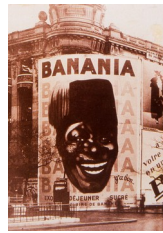
Publicité géante pour Banania, Paris, Grands boulevards, période de la Libération

Cette nouvelle forme d'affichage nécessita en outre la délimitation d'emplacements réservés. Depuis la fin du XIX e siècle, l'évolution a été dans le sens d'une mise en ordre croissante des espaces selon leur destination : respect des façades d'immeubles par le biais de lois interdisant l'affichage sauvage :