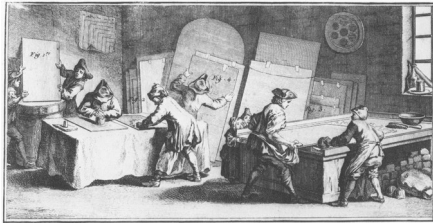
Atelier des miroitiers, Encyclopédie de Diderot et d'Alembert, 1751-1765

Ailleurs, les miroirs étaient très rares. Selon l'historien Alain Corbin, « dans les villages du XIX e siècle, seul le barbier possède une véritable glace, réservée à l'usage masculin. Les colporteurs diffusent de petits miroirs afin que les femmes et les jeunes filles puissent y contempler leur visage ; mais la campagne ignore les glaces dans lesquelles on perçoit la silhouette en entier. Chez les paysans, l'identité corporelle continue de se lire dans les yeux d'autrui, de se révéler par l'écoute d'une perception intérieure.(...) Dans les classes aisées, le code des bonnes manières imposera longtemps à la jeune fille d'éviter de se regarder nue, ne serait-ce que dans les reflets de la baignoire. (...) [Cette] bonne société (...) accumule les glaces dans ses bordels, avant d'en garnir, tardivement, la porte de l'armoire nuptiale. » 1 L'essor de l'armoire à glace date de la seconde moitié du XIX e siècle si l'on en juge par le fait qu'une première mention apparut en 1830 sous la plume de Stendhal et que l'expression proprement dite s'imposa à partir de 1866. La diffusion du miroir, quant à elle, ne devint massive qu'au XX e siècle.