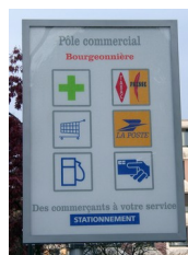
Panneau lumineux d'un centre commercial, Nantes, 2004

On y revient aujourd'hui pour indiquer par exemple l'offre de services d'un centre commercial ou d'une station-service d'autoroute.