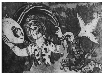
Sirène au miroir convexe, tissu copte, IV e siècle

On sait que les miroirs ont existé depuis l'Antiquité, ne serait-ce qu'en métal poli.