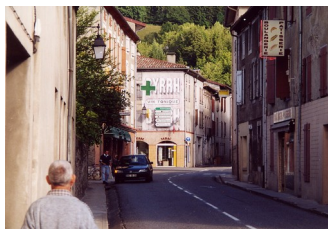
Vieille publicité pour la marque Byrrh, Bélesta, Ariège, 2001

Les bourgs des campagnes, voire les villages eurent leur lot de « réclames », mais selon une densité nettement moindre.