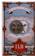
Publicités pour des boîtes à fils, 1870

La publicité imagée commença par assurer la promotion des premiers produits industriels de grande consommation comme le fil à coudre :