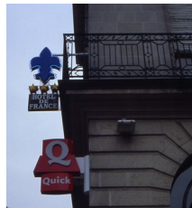
Enseignes diverses, Nantes, 1999

– d'autre part, les enseignes ou l'intitulé du commerce ne font plus corps, ou de moins en moins, avec le local commercial, comme autrefois. Ils se présentent plutôt comme des prothèses visuelles, aisément fixables sur toute façade et tout aussi aisément supprimables.