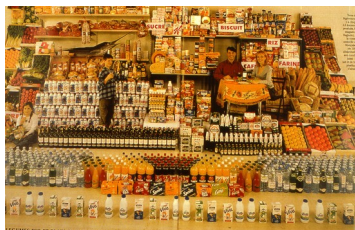
Idem en 1999 (envahissement des emballages et des images)