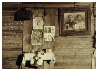
Jack Delano, Intérieur d'une maison de Noirs (portraits photographiques encadrés au mur), 1941