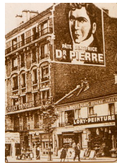
Publicité murale pour la pâte dentifrice du Docteur Pierre, Route de Fontainebleau, Kremlin-Bicêtre, 1936

Les messages publicitaires étaient donc peints directement sur les maisons, contre redevance payée aux propriétaires des murs.