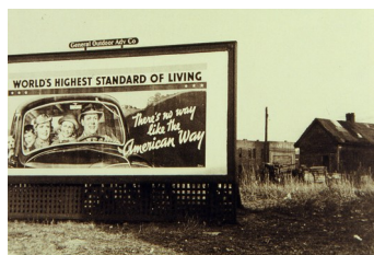
Arthur Rothstein, Birmingham (Alabama), 1937

et réservation d'espaces spécialisés pour la communication commerciale. Grâce à cet encadrement réglementaire, nos villes apparaissent aujourd'hui moins encombrées d'images qu'il y a un siècle, du moins leur centre. Car là où la réglementation ne s'exerce plus, s'installe une véritable débauche de messages publicitaires. C'est ce qu'on trouve en particulier à l'entrée des villes, le long de ces axes routiers qui alignent des grandes surfaces de mobilier, de décoration ou de jardinage, chacune décuplant sa surface réelle par une emprise publicitaire qui dévore les bas-côtés de la route, les trottoirs et les façades. Les Américains furent pionniers en la matière :