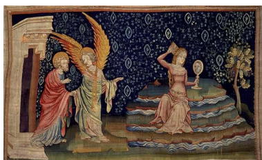
La Grande Prostituée, panneau de la Tapiserie de l'Apocalypse , Angers, 1375-1382

Mais, pendant très longtemps, ils sont restés l'apanage des riches demeures. En voici quelques exemples parmi les premiers représentés en image :