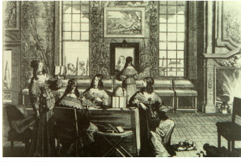
Abraham Bosse, Les Vierges folles (avec un grand miroir), 1635