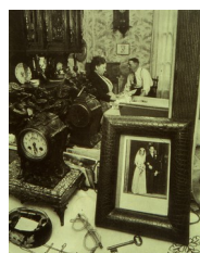
Robert Doisneau, La cheminée de Madame Lucienne (grand miroir et photo de mariage), 1953