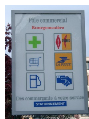
Panneau lumineux d'un centre commercial, Nantes, 2004

On y revient aujourd'hui pour indiquer par exemple l'offre de services d'un centre commercial ou d'une station-service d'autoroute.