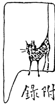
Fig. 3 : Li Shutong, dessin paru dans le Journal du Pacifique ( Taipingyang bao ), 1912.

Feng Zikai recourt à l'encre et au pinceau pour réaliser des vignettes isolées qui se suffisent à elles-mêmes, sans personnage récurrent, et racontent ce qu'il a pu vivre, observer, ressentir. Parfois, une suite de quatre images sont unies par un même thème ou une logique narrative, que l'on appelle sitibua , « images en quatre cases », suivant un modèle qui se répand dans les années 1930 et que l'on retrouve par exemple avec le célèbre San Mao de Zhang Leping, personnage d'orphelin vagabond apparu en 1935. Le format se rapproche alors de celui d'une bande dessinée comme Manger , qui décline de manière humoristique la chaîne alimentaire allant de la crevette et de l'asticot jusqu'au tigre mangeur d'homme.