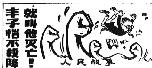
Fig. 1 : Caricature de Feng Zikai de l'époque de la Révolution culturelle

fut exhibé une pancarte autour du cou qui détaillait ses crimes contre-révolutionnaires et dénonçait ses essais comme des « herbes empoisonnées ». Sa série La préservation de la vie fut accusée de propager des idées bouddhistes réactionnaires endormant l'esprit révolutionnaire du peuple. Il refusait d'attacher une grande importance à la Révolution culturelle, qu'il qualifiait de « grande plaisanterie », tout en continuant à peindre dans le plus grand secret. Résister à une situation aussi absurde lui semblait vain. Le meilleur moyen pour lui d'ignorer la Révolution culturelle était de continuer à peindre. La confiscation de son appartement le contraignit à se réfugier avec sa famille au grenier de l'immeuble.