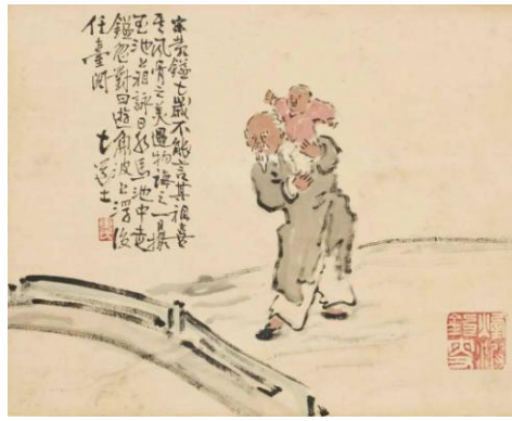
Fig. 2 : Zeng Yandong, Grand-père et petit-fils , 1820, 27 x 32,5 cm.