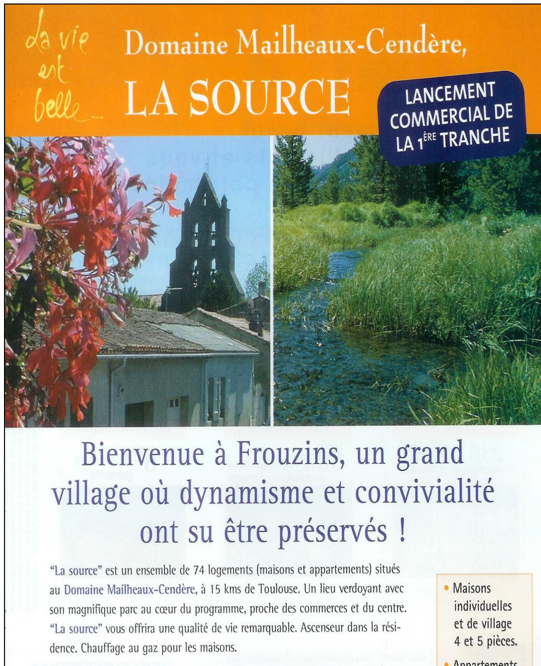
Figure 11.4. Prospectus 1, « La Source » 2004