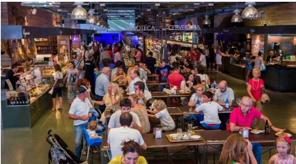
Ilustración 4: Estación Gourmet en Valladolid. Foto: Estación Gourmet en agosto de 2016. 60