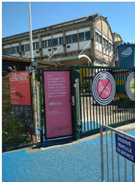
Ilustración 5: un cartel pegado en una de las dos puertas de entrada por los responsables de Ground Control, en el que se pide a los clientes que respeten a los vecinos. Crédito de la foto: Jonathan Haquet, 30 de julio de 2020.

La empresa que explota Ground Control es consciente de la contaminación acústica que genera. Considera que esta es la principal fuente de descontento de los vecinos y que las quejas pueden conllevar el riesgo de cierre administrativo. Por eso, ha puesto en marcha varias medidas, como el cierre del local a más tardar a la 1:00 de la madrugada, es decir, una hora antes de lo autorizado por la prefectura de París para este tipo de establecimientos (entrevista a La Lune Rousse, 2021), o la instalación de carteles en las entradas para pedir a sus visitantes que no sean demasiado ruidosos (Ilustración 5).