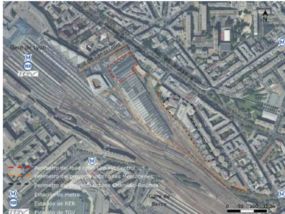
Ilustración 2: el contexto urbano del food court Ground Control en 2018 42 Realización: J. Haquet.

Este sitio de la SNCF, dedicado a la logística ferroviaria desde 1867, ocupa seis hectáreas y ha sido objeto de una reducción gradual de sus actividades desde 2015. 43 El proyecto urbanístico asociado puede dividirse en tres fases: una fase preoperativa que consiste, en particular, en hacer legal la constitución de una primera urbanización en la parte sur de 2013 a 2019 y en poner en marcha la apropiación del sitio con la apertura de un food court, desde 2017, en la parte norte; una primera fase operativa iniciada en 2016, que debería extenderse hasta 2026; y una segunda fase que se supone comenzará en 2022 y podría llegar hasta 2030. 44 Ahora, preguntémosnos cómo encajan los food courts en estos proyectos urbanos.