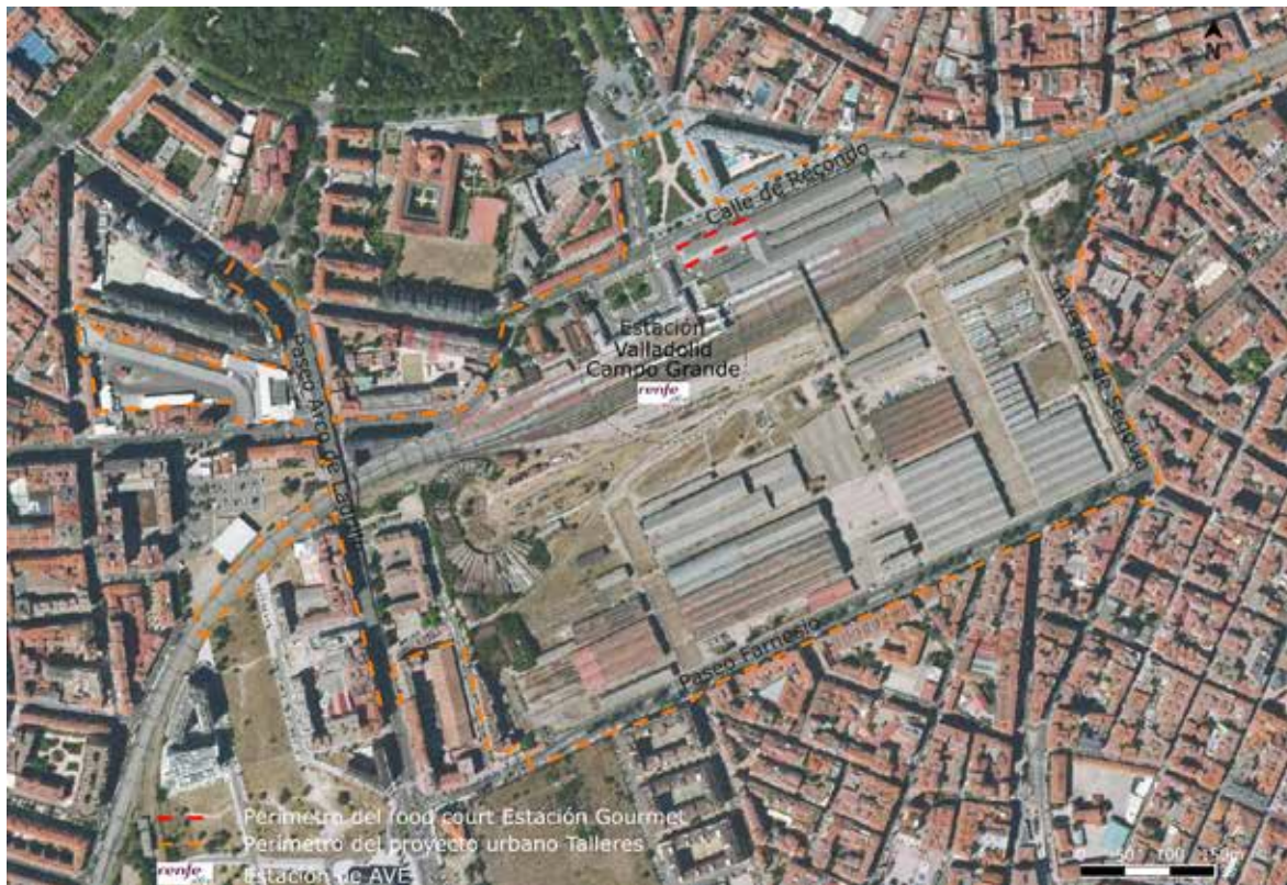
Ilustración 1 : El contexto urbano del food court Estación Gourmet en 2020

Según nuestra investigación documental y nuestras observaciones sobre el terreno en agosto de 2021, no parece haberse llevado a cabo ninguna obra de desarrollo concreta prevista en el proyecto urbanístico desde 2003.