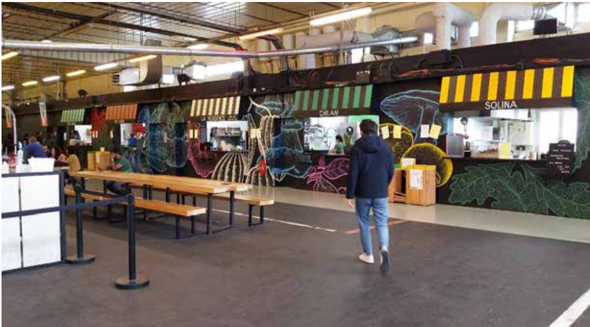
Ilustración 3: Ground Control en la nave Charolais de París. 5 de mayo de 2019.