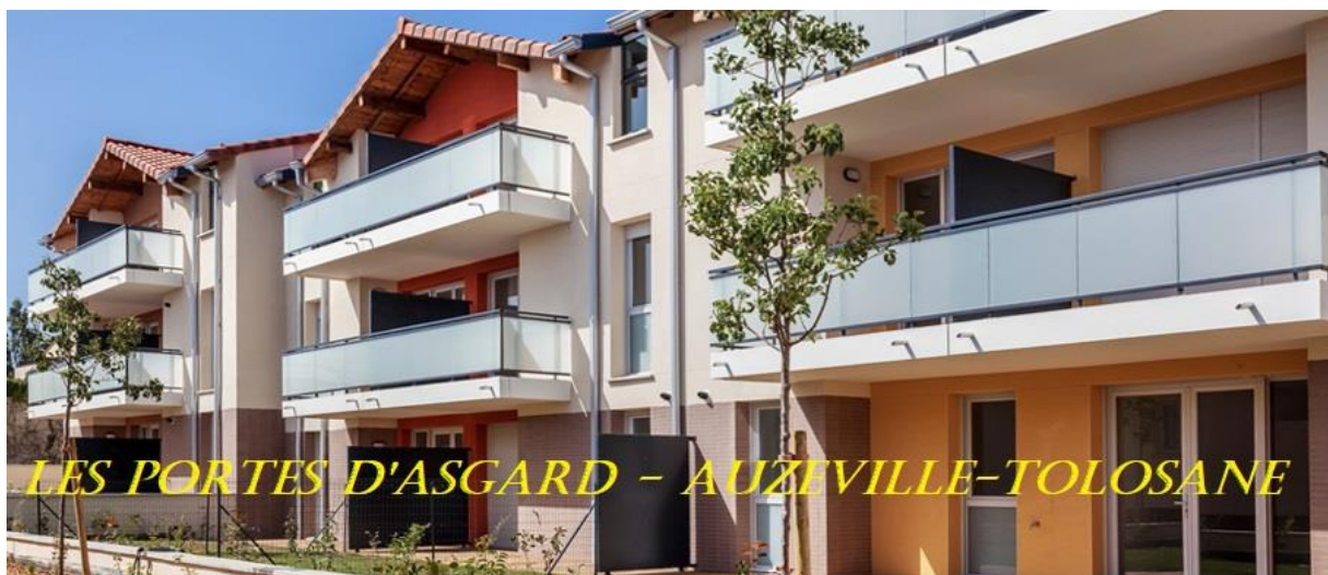
ILLUSTRATION 9 : Les Portes d’Asgard, 2019, publicité d’un promoteur immobilier toulousain.

Une hypothèse se fait jour, les liens entre le cinéma et les images véhiculées par la mondialisation changent notre perception du monde, une marvelisation des villes s’observent, à savoir : a/ sur des bases de culture populaire et de film, série ou autres supports, la ville devient une scène pour des appareillages multiples, b/ de grands groupes financiers ou du divertissement déclinent cette expression populaire dans les villes, c/ cela s’inscrit dans des parcs, des hôtels, des quartiers, des murs de ville avec des publicités officielles ou des tags, d/ les grandes métropoles mondiales sont des sources d’inspirations visuelles, une uniformisation se perçoit à l’échelle du monde, le digital contribue à créer des univers ou représentations parallèles.