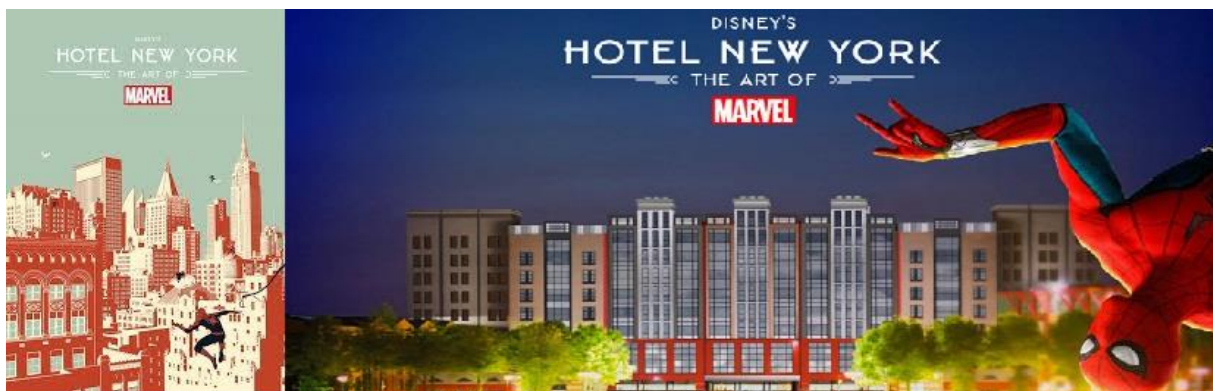
ILLUSTRATION 8 : Disney Hotel New York, The Art of Marvel, Paris, Publicité pour son ouverture, 2021. Groupe Disney, copyright. *

Il en est de même de l'hôtel « New York » à Marne-la-Vallée. Connaissant une désaffectation, la structure trouve dans les héros Marvel, un moyen de redessiner et designer autrement son principal hôtel pour les touristes. Le Disney's Hotel New York The Art of Marvel devant ouvrir ses portes en 2021, un 4 étoiles recréant l'univers d'une galerie new-yorkaise d'art moderne pour accueillir des œuvres ayant marqué 80 ans d'histoire Marvel, ainsi que de nouvelles créations réalisées en exclusivité pour le grand hôtel. Au total, plus de 300 œuvres créées par plus de 95 artistes y seront exposées donnant une atmosphère de New York à Paris dans un cadre Art-Déco.