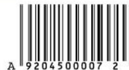
ILLUSTRATION 7 : Les nouvelles temporalités urbaines du MCU à travers la réécriture des expositions universelles américaines. Tickets d'un exposant. 2019.