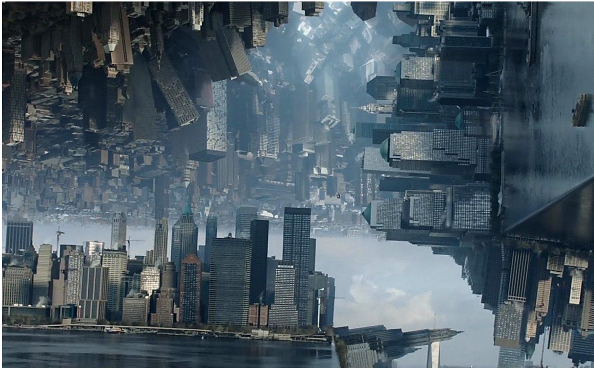
ILLUSTRATION 3: Le New York astral, Doctor Strange, 2016, Marvel Studio, copyright.

astral » séparé du corps physique a été bien discuté dans diverses formes d'ésotérisme, - Mais ILM devait encore déterminer à quoi cela ressemblerait réellement à l'écran. Au fur et à mesure que le film progressait, le travail sur le corps Astral s'ajustait vers d'autres retouches et ILM se concentrerait principalement sur les vastes séquences de New York et de Hong Kong ».