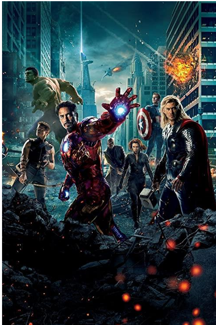
ILLUSTRATION 2 : Avengers 2012, guérilla urbaine à New York avec la tour Stark, affiche du film, dossier presse, 2012, Marvel Studio, copyright.

Le MCU impose très souvent à travers la ville de New York la finalité qu'encourent nos civilisations, le fait de voir disparaître toute une culture par « l'évaporation » de ses habitants et la destruction de la cité.