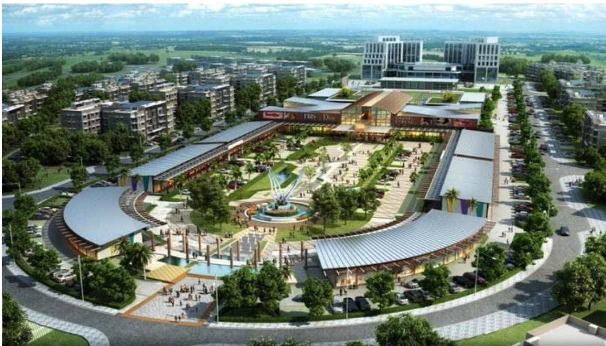
ILLUSTRATION 5 : Wakanda smart city au Rwanda 2029, État africain et projet d'une ville de plus de 35 000 habitants. Gouvernement rwandais.

bâtiments par des raccourcis reposant sur la physionomie et la ressemblance aux premiers abords, avec la Bitexco Financial Tower à Hô Chi Minh-Ville (Saïgon) au Vietnam, les articles de la presse locale voire internationaux peu sérieux font tout de suite l'assimilation entre le film Avengers et la Tour Stark : « le bâtiment qui aurait servi ou bien a servi de modèle pour le film » xix , il en est de même de visiteur remarquant une ressemblance du paysage urbain, ceci devenant parfois viral dans le domaine des réseaux sociaux. À cela, le fait de voir apparaître des projets comme Wakanda Smart City au Rwanda nous fait entrevoir que les films impulsent aussi des imaginaires et des correspondances aisées ou faciles pour les populations locales et certains dirigeants africains voulant créer leur propre utopie comme récemment au Sénégal avec le célèbre chanteur Akon devenu promoteur immobilier xx .