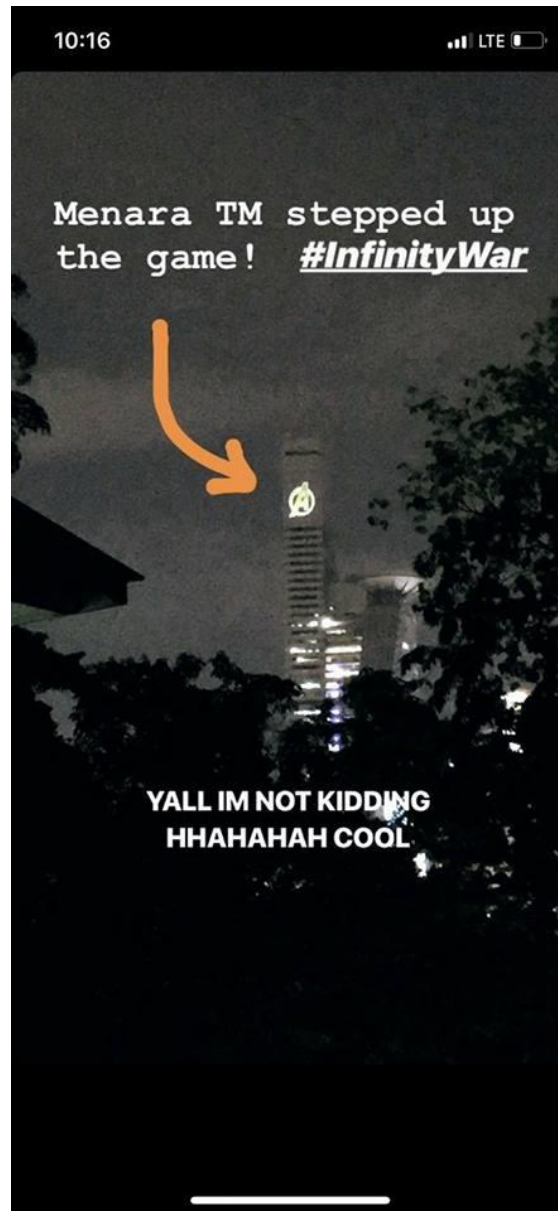
ILLUSTRATION 4 : Photographie de portable retouchée montrant la Tour Menara TM Tower, 2012.

Entre super-héros, paysage urbain et mondialisation de la culture, l'édifice imaginaire devient un bâtiment, mais aussi un site touristique employant comme élément promotionnel pour les films Avengers , un logo correspondant à l'univers Marvel, le A de Avengers.