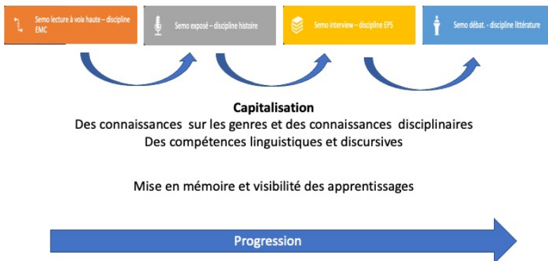
Figure 1 : Programmation des enseignements et progression des apprentissages des élèves.

La programmation de SEMO tient compte du découpage en cinq périodes des enseignements à l'école élémentaire française. La première période (septembre/octobre) ne comprend pas d'enseignements explicites à proprement dire. C'est un temps pendant lequel l'enseignant crée un environnement sécurisant. Des activités ritualisées sont mises en place pour établir un climat de confiance dans la classe et que les élèves osent prendre la parole. Les quatre périodes suivantes de l'année scolaire sont chacune consacrées à l'enseignement de quatre genres dans quatre disciplines différentes pour renouveler les enjeux des prises de parole selon des problématiques disciplinaires.