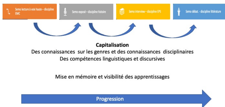
Figure 1 : Programmation des enseignements et progression des apprentissages des élèves.

La programmation de SEMO tient compte du découpage en cinq périodes des enseignements à l'école élémentaire française. La première période (septembre/octobre) ne comprend pas d'enseignements explicites à proprement dire. C'est un temps pendant lequel l'enseignant crée un environnement sécurisant. Des activités ritualisées sont mises en place pour établir un climat de confiance dans la classe et que les élèves osent prendre la parole. Les quatre périodes suivantes de l'année scolaire sont chacune consacrées à l'enseignement de quatre genres dans quatre disciplines différentes pour renouveler les enjeux des prises de parole selon des problématiques disciplinaires.