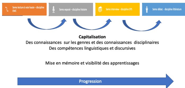
Figure 1 : Programmation des enseignements et progression des apprentissages des élèves.

La programmation de SEMO tient compte du découpage en cinq périodes des enseignements à l'école élémentaire française. La première période (septembre/octobre) ne comprend pas d'enseignements explicites à proprement dire. C'est un temps pendant lequel l'enseignant crée un environnement sécurisant. Des activités ritualisées sont mises en place pour établir un climat de confiance dans la classe et que les élèves osent prendre la parole. Les quatre périodes suivantes de l'année scolaire sont chacune consacrées à l'enseignement de quatre genres dans quatre disciplines différentes pour renouveler les enjeux des prises de parole selon des problématiques disciplinaires.