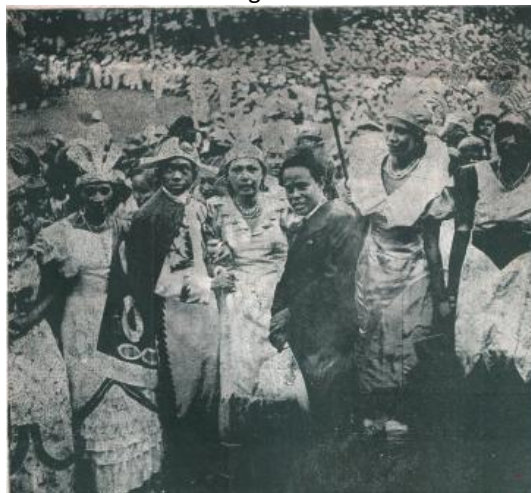
trouver la légende

Il s'avère après examen que la genèse de cette pièce fut assez mouvementée.