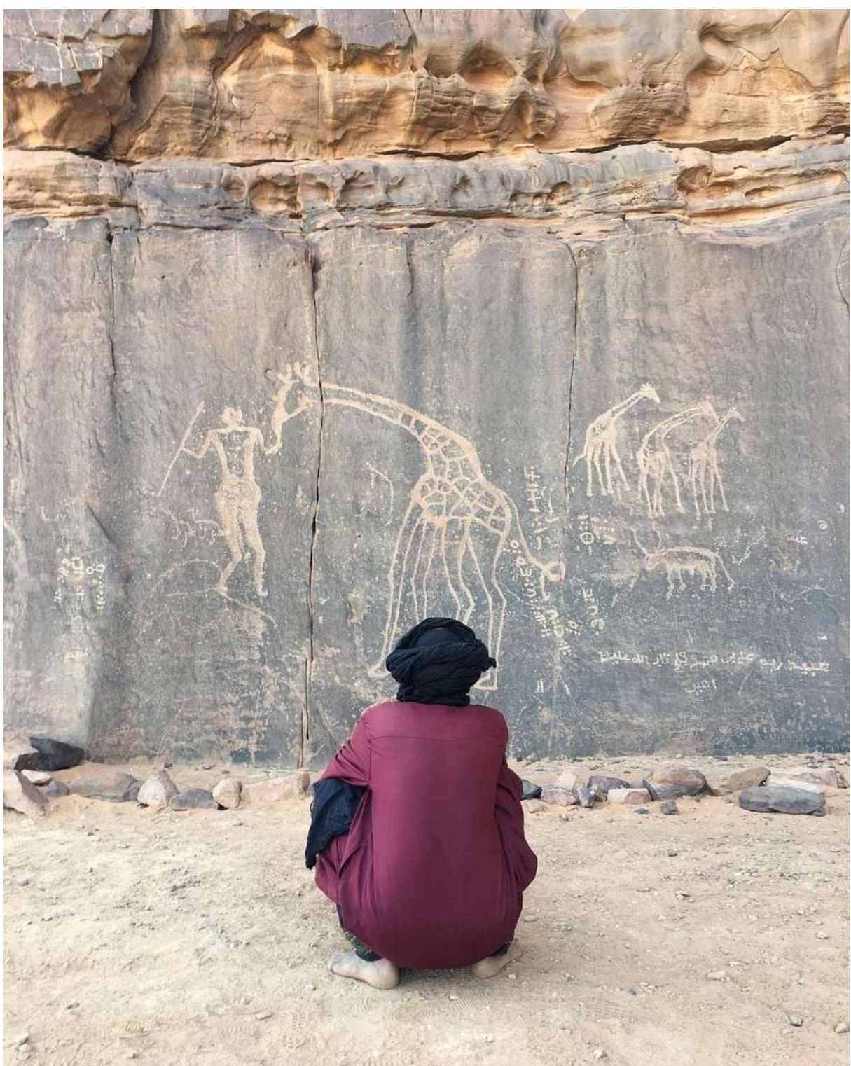
1. Libisch & gravures - Tassili n'Ajjer (Niger).