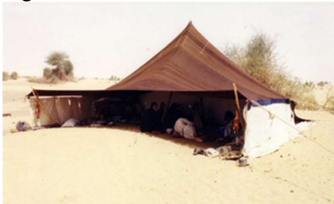
Fig. 2: la tente comme enveloppe familiale