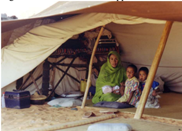
Fig.3 : tente et vie sociale au désert