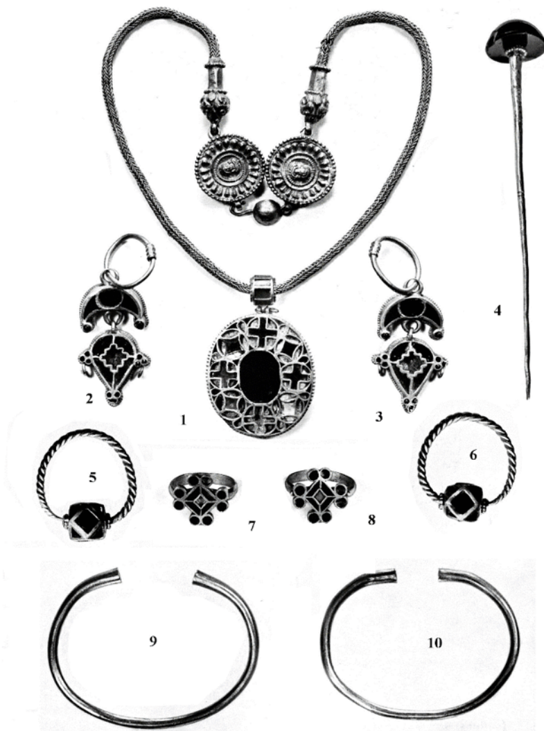
Рис. 1. Ольвийский «клад» (по: Ross, 1965, pl. 79–82).