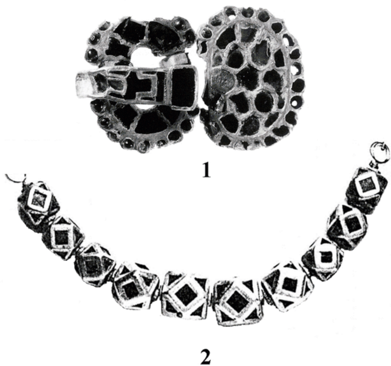
Рис. 2. Вещи постгуннского времени из Ольвии. 1 – ; 2 – по: Romans and Barbarans, 1976, Nr. 157.