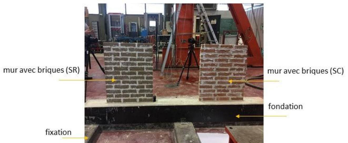
Figure 1 : Murs construits avec des briques de sédiments mexicains : briques renforcées (à gauche), briques cuites (à droite)

Au laboratoire, les murs ont été construits en une seule rangée de briques et les joints de mortier horizontaux et verticaux d'une épaisseur d'environ 10 mm étaient entièrement remplis (figure 1). Après construction, un délai de 15 jours avant toute sollicitation a été observé. Les tests ont donc été effectués après 15 jours au lieu des 28 jours recommandés pour des raisons pratiques et techniques. A 15 jours, il a été observé pour le mortier utilisé, que la résistance à la compression avait déjà atteint plus de 85% de la résistance à 28 jours.