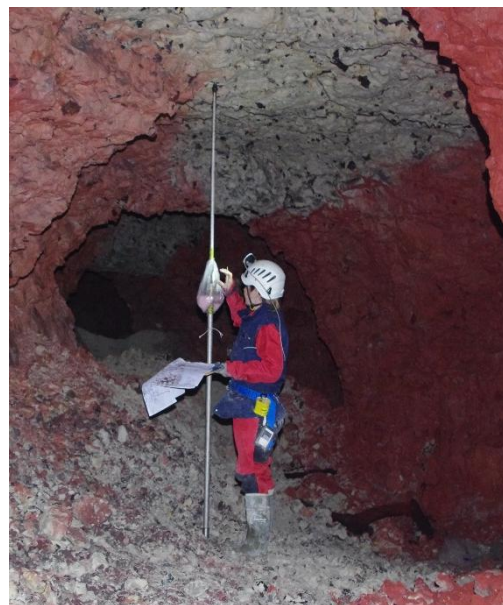
Figure 1. Inspection visuelle d'une carrière souterraine

Pour faciliter la gestion et le suivi de ces relevés visuels directs et les combiner facilement à d'autres données collectées (par exemple des photographies, des levés par drone pour caractériser des zones inaccessibles, voire d'autres données instrumentales