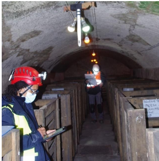
Figure 4. Inspections géotechniques avec la tablette en mars 2020