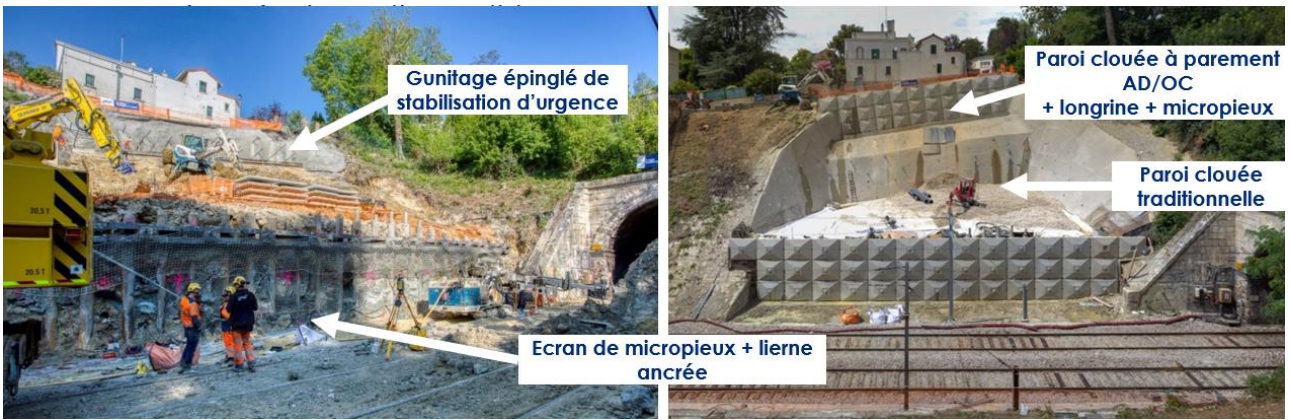
Figure 1. Chantier de SEVRES VILLE-D'AVRAY (avant après)