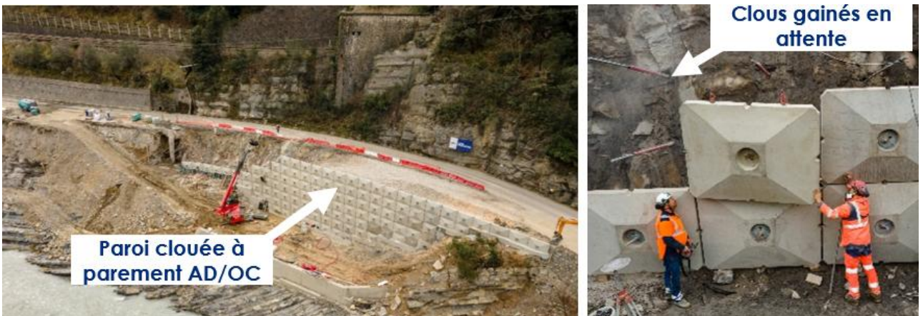
Figure 2. Chantier d'une brèche type dans la ROYA (Travaux en cours)