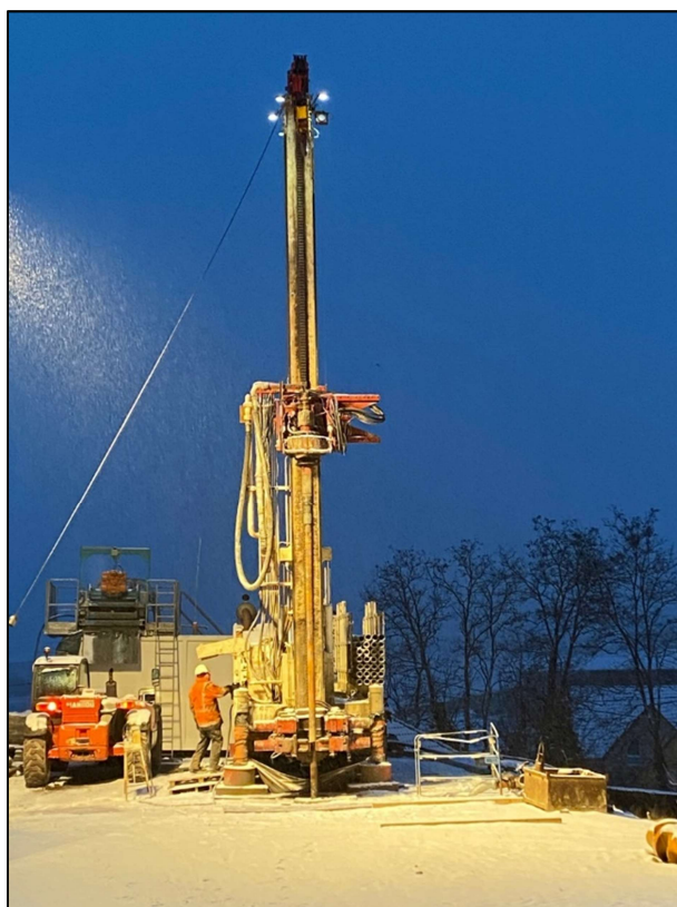
Figure 3. Travaux de forage à Lochwiller (67) en février 2021

passé et aux quantités effectivement réalisées, contrôlés et optimisés par le MOE présent en permanence sur site. L'expérience du MOE, associé aux phases de conception et de consultation du projet, a été un élément clé de la réussite de cette opération. L'expérience en ingénierie de forage correspondait à un des critères de sélection prépondérant lors de la consultation pour le marché de Maîtrise d'œuvre.