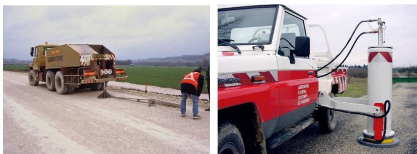
Figure 1. Essai de plaque (à gauche) et essai à la Dynaplaque II (à droite)

Certaines valeurs de module sont très fréquemment demandées sur chantier comme par exemple 50, 80 ou 120 MPa qui correspondent respectivement aux limites basses des classes de plateformes PF2, PF2qs et PF3.