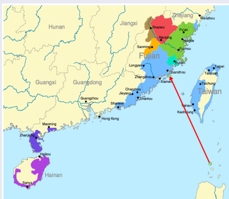
Figure 1. La carte qui représente la localisation de différentes variétés Min (couleur bleue: Southern Min) ainsi que la ville Quanzhou.

Comparaison de deux systèmes phonologiques (voir 1) :