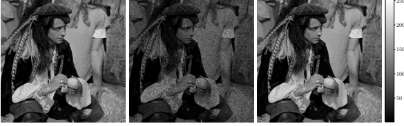
FIGURE 2 – Inpainting d'image N = 1024 \times 1024 . De gauche à droite : vérité terrain, observations et estimateur MMSE.

de deux processeurs Intel Xeon E5-2695 v4 series de 18 cœurs chacun, fonctionnant à 2.1 GHz. Un noeud k correspond ici à un processus associé à un cœur physique. L'algorithme a été implémenté en Python grâce à la librairie mpi4py [13].