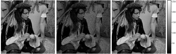
FIGURE 2 – Inpainting d'image N = 1024 \times 1024 . De gauche à droite : vérité terrain, observations et estimateur MMSE.

de deux processeurs Intel Xeon E5-2695 v4 series de 18 cœurs chacun, fonctionnant à 2.1 GHz. Un noeud k correspond ici à un processus associé à un cœur physique. L'algorithme a été implanté en Python grâce à la librairie mpi4py [13].