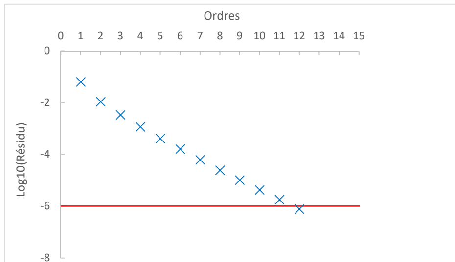
Figure 3 : Evolution du log10 du résidu en fonction de l'ordre de troncature des séries pour le premier mode de vibration de l'exemple de la plaque composite carrée de Litewka et Lewandowski [6] avec \tau = 0,016 , \alpha = 0,52 , \frac{E_\infty}{E_0} = 2 . (MNOE).