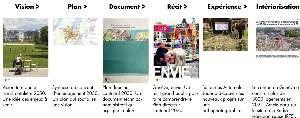
Figure 1. Usage du récit de communication en urbanisme : un modèle linéaire