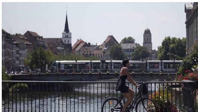
Figure 3 Tramway et vélo à Strasbourg - © Pokaa

l'efficacité de l'action individuelle pour la protection de l'environnement : cette action n'a de sens que si un nombre suffisant de personnes agissent. Le sentiment d'impuissance face à la pollution de l'air est plus fort encore : à part limiter leurs déplacements en voiture, les citoyens ne savent pas quoi faire et ils énoncent que ce n'est pas à eux de tout faire. Dans leur majorité, ils soulignent que les contraintes financières sont trop importantes pour l'achat d'une alimentation plus respectueuse de l'environnement, pour la rénovation leur logement ou encore pour prendre le train. Ils soulignent le manque d'offre adéquate pour se déplacer, mais reconnaissent aussi la difficulté de changer leurs habitudes, d'adopter de nouvelles contraintes dans leur quotidien. Ils demandent plus d'information sur ce qu'ils pourraient mettre en place et sur les actions d'accompagnement. Ils apprécient le développement des pistes cyclables, des zones piétonnières, des parking relais, d'extension du réseau de transport en commun. Ils demandent aussi plus de décisions politiques pour faire baisser les prix. De ce point de vue, la gratuité des transports publics