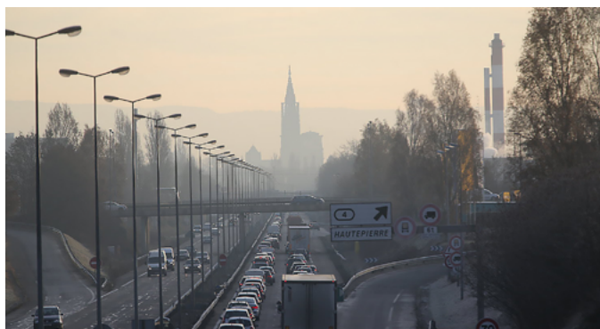
Figure 2 La circulation automobile (ici l'A350 à l'entrée de Strasbourg) et le chauffage au-bois sont les émetteurs essentiels de particules fines en hiver

Ils ont intégré qu'ils sont exposés quotidiennement au risque qu'est la pollution de l'air et que cette dernière est l'affaire de tous. S'ils décrivent toujours cette pollution à travers leurs expériences de perceptions, c'est-à-dire par leurs sens (odorat, vue, dépôts sur les bâtiments, le visage, les cheveux, etc), ils ont accepté qu'une partie de la pollution de l'air est invisible et inodore. Les plus concernés sont ceux qui sont confrontés à une pollution de l'air plus visible. La différence la plus notable entre les entretiens menés