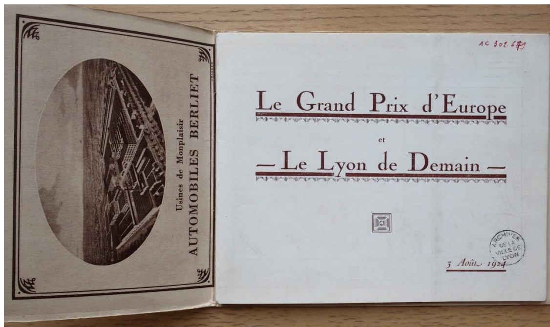
Figure 3. Extrait de la brochure de l'ACR « Le Grand Prix d'Europe – Le Lyon de demain », 1924 AML 1C302679

mondiale 21 . Les constructeurs lyonnais n'en sortent pas indemnes et accueillent le Grand Prix 1924 comme une occasion d'accompagner la relance de leur production, comme le montre la brochure éditée par l'ACR à 50 000 exemplaires pour le Grand Prix 1924, qui comporte des encarts de constructeurs locaux (voir ci-dessous Figure 3). Le prospectus vante surtout les mérites de la ville de Lyon, avec sa gastronomie, ses projets d'urbanisme et ses entreprises locales, dont certaines soutiennent les courses pour des motifs publicitaires, dont la firme Le Soliditit Français qui a travaillé sur une partie du revêtement ou le constructeur automobile local d'automobiles et de poids-lourds Berliet 22 .