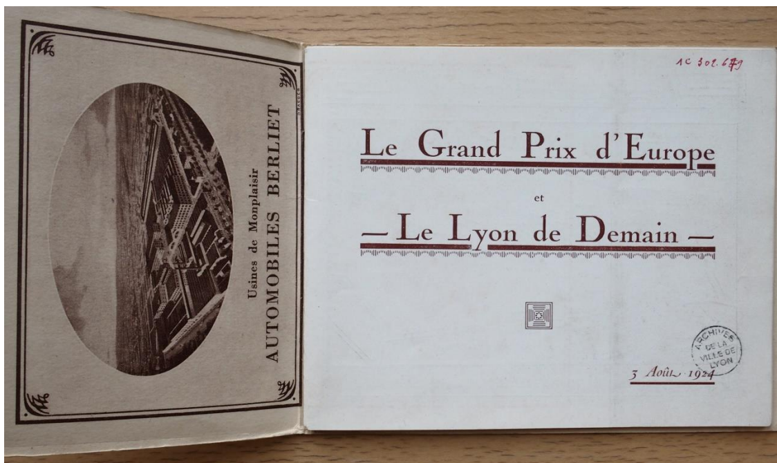
Figure 3. Extrait de la brochure de l'ACR « Le Grand Prix d'Europe – Le Lyon de demain », 1924 AML 1C302679

mondiale 21 . Les constructeurs lyonnais n'en sortent pas indemnes et accueillent le Grand Prix 1924 comme une occasion d'accompagner la relance de leur production, comme le montre la brochure éditée par l'ACR à 50 000 exemplaires pour le Grand Prix 1924, qui comporte des encarts de constructeurs locaux (voir ci-dessous Figure 3). Le prospectus vante surtout les mérites de la ville de Lyon, avec sa gastronomie, ses projets d'urbanisme et ses entreprises locales, dont certaines soutiennent les courses pour des motifs publicitaires, dont la firme Le Soliditit Français qui a travaillé sur une partie du revêtement ou le constructeur automobile local d'automobiles et de poids-lourds Berliet 22 .