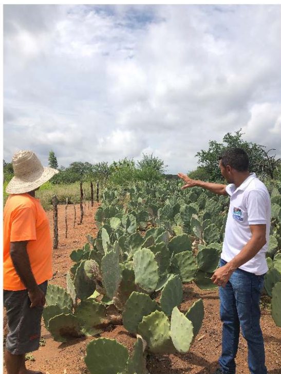
Figura 3 - Técnico extensionistas de entidade executora do Programa Cisternas