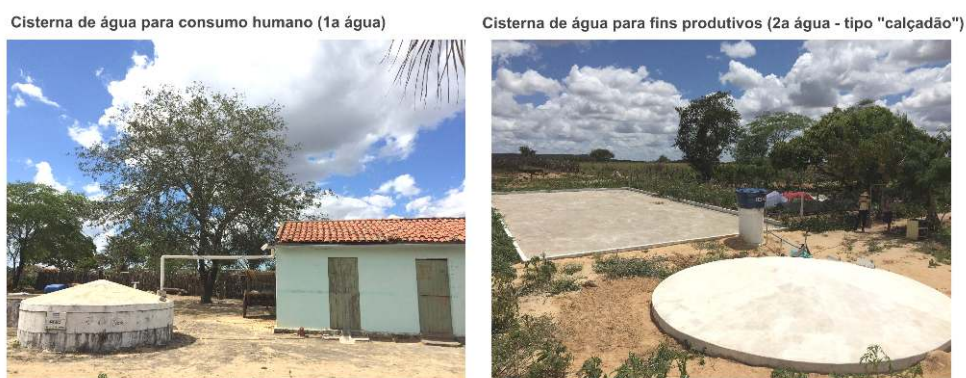
Figura 2 – Principais tipos de cisternas disseminadas pelos programas

Fonte: Patrícia Mesquita, Paulo Afonso – outubro/2017