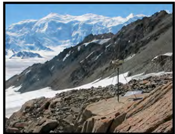
Figure 2: Campagne GPS au pied du Mont Logan, 2 ème plus haut sommet d'Amérique du Nord, Yukon, Canada. (Photographie Stéphane Mazzotti).

Le parc mobile GPSMOB offre un support à une large panoplie de projets de recherches intégrant les mesures GNSS. Plusieurs exemples sont présentés dans les articles de cette newsletter, recouvrant des domaines aussi variés que le cycle sismique des zones de subduction, la néotectonique et le volcanisme des rifts, les phénomènes météorologiques extrêmes, ou l'étude des variations du niveau marin. En pratique, la majorité des campagnes GNSS soutenues par GPSMOB implique des déploiements de stations temporaires variant de quelques stations sur quelques jours à plusieurs dizaines de stations sur plusieurs semaines. Comme illustré sur les photographies, l'équipement GNSS de GPSMOB doit permettre des déploiements dans des conditions parfois extrêmes allant des déserts Jordaniens aux calottes glaciaires du Yukon. Pour répondre à ces besoins, GPSMOB dispose de différents types de récepteurs et antennes (GPS et GNSS pour les plus récents), de système de mise en station (trépieds, mats, etc.), et de panneaux solaires permettant des mesures autonomes et continues sur de longues périodes.