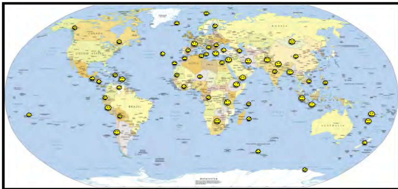
Figure 3: Localisations des campagnes GNSS depuis 1991.

nance de l'équipement mis à disposition, GPSMOB offre aux utilisateurs un site web permettant le suivi du matériel, une analyse des caractéristiques des récepteurs et antennes, ainsi que les résultats de tests techniques ( https://gpscope.dt.insu.cnrs.fr/spip/spip.php?rubrique17 ). A titre d'exemple, GPSMOB conduit actuellement une série de tests sur plusieurs antennes et récepteurs GNSS afin de déterminer leurs caractéristiques et performances in-situ et de guider les choix d'achats de futurs équipements pour la communauté géodésique française (RENAG, laboratoires universitaires, etc.).